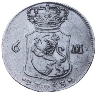
Dansk rejsedaler 1733 præget i København under Christian 6. (1730-1746), (H.5).

Fælles for alle fire mønter var, at bagsidemotivet viste den norske løve, som ellers kendetegnede norske mønter. Den norske løve var således en gestus overfor nordmændene, idet en del af mønterne blev givet ud under de fire rejser i Norge; men mønterne er og bliver danske.