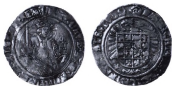
Sydlige Nederlande, Brabant, Karl I (V) af Spanien (1506-1555): Real d'or u.år.

3: Den Nederlandske Real (Reaal, Regal) er præget 1487-88 af Maximilian. Det var en sølvmønt med vægt