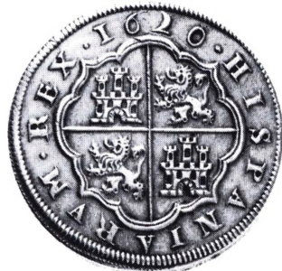
Spanien, Philipp III (1598-1621): 8 Realer 1620.

Med opdagelsen og erobringen af dele af Amerika kom realen til at spille en overordentlig stor rolle, idet der i de nye områder blev fundet og udvundet store mængder af både sølv og guld. Der blev etableret møntværksteder i nærheden af de store miner i Mexico, Peru og Bolivia, og i Mexico begyndte møntprægning i foråret 1536.