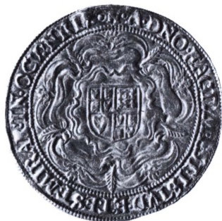
England, James I (1603-1625): Rose Ryal (1604-19).

dien 33 shillings. I 1619 gik man tilbage til 30 shillings mønter, som indtil 1625 er præget med værdi-indikation XXX over skjoldet på møntens bagside. Møntens vægt var i 1606 213 1/3 grains (13,823 g), men faldt senere til 196,5 grains (12,733 g).