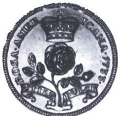
Rosa Americana 2 pence 1733.

halfpence i Irland. Georges I's laurbærkransede portræt på forsiden er det samme, medens bagsiden bærer en stor rose og omskriften: ROSA AMERICANA – UTILE DULCE. Disse fandtes i værdierne twopence, penny og halfpenny.