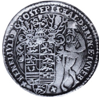
Braunschweig-Wolfenbüttel, Heinrich Julius (1589-1613): Lügentaler 1597.

den udbredte bagtalelser og løgne. Denne fremstilling skulle vise hertugens triumf over sine adelige modstandere, der havde klaget over ham til det kejserlige hof. Den fjerde er »Wespentaler« eller »Mückentaler« (hvepsedaler eller myggedalere) 1599