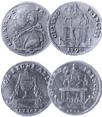
Forskellige typer regnepennige/spillemønter fra 1700-tallets slutning.

ninge, overgik til at fremstille spillemønter, og fra omkring 1800 var mange af disse stykker forsynet med indskrifter som: Spielmarke, Spielpfennig, Spielmünze eller Jeton. Regnepenninger har også i Danmark været meget udbredt, og der gøres jævnligt fund i jorden af tilfældigt tabte stykker. De fleste af disse regnepenninger er fremstillet i messing, og mange af de tidligere typer efterlignede datidens guldmønttyper. Det er årsag til, at mangen en ukyndig møntsamlers pludselig har troet at have fundet en gammel guldmønt, som i stort set alle tilfælde viser sig at være en messing regnepennig.