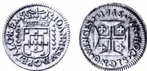
Portugal, Joao V (1706-1750): Quartinho 1716.

Quartinho (Quarto). Portugisisk guldmønt indført 1677 af værdi som