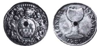
Køln: Ratszeichen 1730.

Ratszeichen (da.: Rådstejn). Disse tjente i en del tyske og udenlandske stater som en slags godtgørelse til rådsherrerne for deres deltagelse i