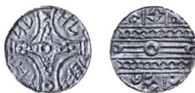
Dansk runemønt (Hbg. 39, Moltke 369) præget under Svend Estridsen (1047-1075).

Runemønter. En hovedsagelig dansk og norsk foreteelse. I Danmark optræder runer på mønter i en kort periode ca. 1065-1074, dvs. i de sidste år af Sven Estridsens regeringstid. I denne korte og hektiske tid fik runerne en renaissance – måske som et udtryk for en stærkere nationalis-