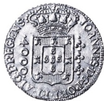
Brasilien, João (1799-1818): 4000 Reis 1806.

Rejsedaler. Betegnelse for en række større danske sølvmonter præget i anledning af danske kongers norgesrejser 1704, 1732-33, 1749 og 1788 (kronprins Frederik). De tre første er kronrigsdalere, dvs. 6 mark-stykker, medens den sidste er en kurantdaler (1 rigsdaler kurant). Denne mønt er i øvrigt den eneste hele rigsdaler, der er udmøntet efter kurantmøntfoden.