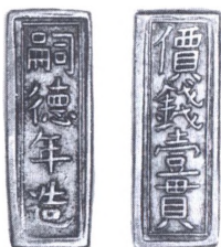
Vietnamesisk 1 quan fra Tu Duc (1848-1883).

Quart (Quarto). Fra 1802 indførte private firmaer i Gibraltar nogle monttegn (tokens): 1 quart eller quarto og 2 quarts eller quartos i kobber, som skulle gælde for 1/2 og 1 penny, og 1842 indførte englænderne regulære monter i værdierne 1/2, 1 og 2 quarts, der modsvarede farthing, 1/2 penny og penny. 24 quarts (quartos)=1 real.