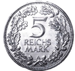
Tyskland, Weimarrepublikken: 5 Reichsmark 1925.

mark, der skulle lette overgangen fra den store inflation. 1 billion gamle papirmark=1 rentenmark=1 reichsmark. Den endelige afvikling af reichsmark fandt sted 1948 med indførelsen af DM (Deutsche Mark).