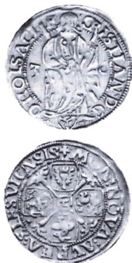
Rhinsk gylden 1536 præget i Gottorp under den danske konge Christian 3. (1534-1559), (G.131).

Rider. Skotsk guldmønt på 5,18 g første gang udmøntet under James