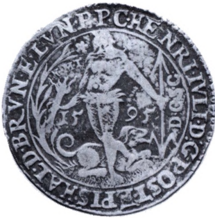
Braunschweig-Wolfenbüttel, Heinrich Julius (1589-1613): Rebellentaler 1595.

som følge af stridigheder med landadelen, særlig slægterne Saldern, Steinberg og Stockheim, præge en række spottedalere i Goslar og Osterode. Den første er »Rebellentaler«