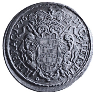
Republikken Ragusa: Rektordalar (= 1/2 sølvdukat eller 60 grosseti) 1776.