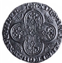
Frankrig, Philippe VI de Valois (1328-1350): Royal d'or u.år.

i modsætning til petit royal d'or, der også er kendt under navnet → man-telet d'or, som blev introduceret 1305. Royal d'or, hvis vægt faldt til ca. 3,75 g eller mindre, er sidst præget under Charles VII (1422-1461).