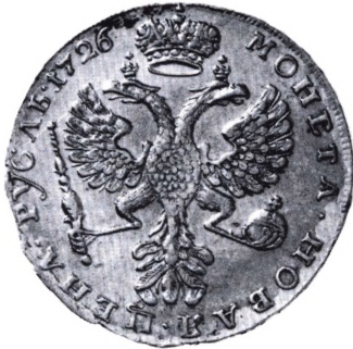
Rusland, Katarina I (1725-1727): Rubel 1726.

1000 og 1100-tallet: 210-185 g, 1200 og 1300-tallet: 105-92 g, og 1400 og 1500-tallet: 70-61 g. Senere faldt de til 51-47 g, og under Peter d. Store faldt grivna rublens vægt fra 33 til 28 g. Som → regnemønt (regnerubel) havde den værdien 100 sølv kopk. Rubelmønten blev indført relativt sent. Et forsøg fandt sted 1654, hvor man overprægede udenlandske dalere. De var nærmest at betragte som nødmønter, og da arbejdet med udglødning og prægning var for stort, fandt man 1655 på at kontramarkere en række europæiske dalere med et lille rektangulært stempel med årstallet 1655 samt et lille rundt kontramærke forestillende en rytter