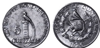
Guatemala: 5 Quetzales 1926.

Quattrino. Lille italiensk sølv- eller billonmønt til en værdi af 4 piccoli. Mønten er præget i mange af de italienske småstater og byer samt af Vatikanet (Kirkestaten). Den var især udbredt fra 1300-tallet til midt i 1600-tallet. Senere var det undertiden også en kobbermønt, der holdt sig helt op til midt i 1800-tallet. Der er også udmøntet multipla som 2, 3, 5, 6 og 10 quarttrino. 2 Q.=1 duetto; 3 Q.=1 soldo og 1 Q.=2 sestini.