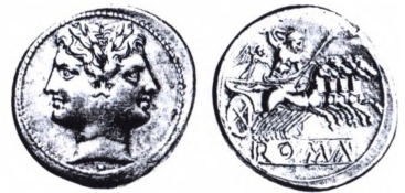
Romersk Republik: Quadrīgatus (225-212 f.Kr.).

Quadrīgatus. Betegnelser for forskellige sølvmonter, f.eks. didrachmer og denarer fra den romerske re-