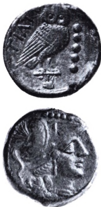
Apulien: Bronze quincunx ca. 217 f.Kr.

Quincunx. Latinsk betegnelse for en mønt med værdi 5 unciae angivet ved 5 værdi-punkter. Den forekom-