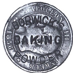
Fransk 10 centimes 1856 forsynet med engelsk reklamebudskab om Borwick's bagepulver.

med ejer eller firmanavn og sendt i cirkulation for på den måde at gøre reklame. Den engelske fabrikant af »Pears Soap« lod importere 250.000 franske 10 centime stykker, som i England var gyldige for 1 penny. Disse blev stemplet med »PEARS SOAP« og sat i cirkulation af de en-