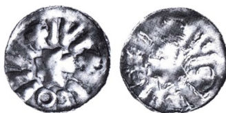
Sachsen, Otto II/Otto III (973-1002): Randpfennig (Sachsenpfennige).

Sachsenpfennige , der også har navne som wendepfennige, (hoch)-randpfennige eller kreuzpfennige, er mønter med en høj udhamret kant præget i 900 og 1000-tallet. Forskere har oprindeligt anset dem for polske, men er i dag enige om, at de er tyske og præget i Sachsen. De første fra 900-tallet er store i blanketten og