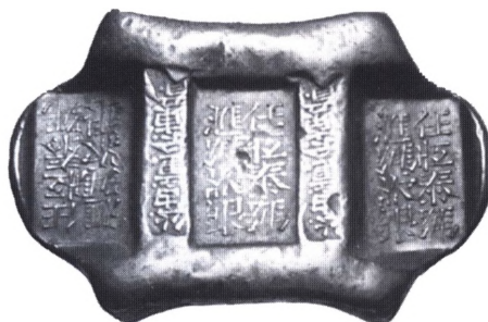
Kinesisk saddelmønt fra Yunan provinsen, hvor de var i brug fra ca. 1875 til 1933.

Saddelmønt. Betegnelse for en særlig type → sycee sølvbarrer fremstillet i Yunnan provinsen i Kina ca. 1875-1912. Den gennemsnitlige vægt var ca. 183 g (dvs. 5 Tael=187 g), og mønten havde form som en ridesaddel, hvilket har givet den det kinesiske navn: Ma An Yin (heste sadde sølv). Den er produceret i store mængder af forskellige bankhuse og anvendtes meget på Yunan-Burma handelsruten. Det er derfor ikke underligt, at den i dag er den mest almindelige sølvbarre-form på den sydlige strækning af ruten (Thailand). Fra midten af 1920'erne begyndte den at blive erstattet af republik-sølv-dollar-mønterne med portræt af Yuan Shihkai, og i 1933 blev den forbudt.