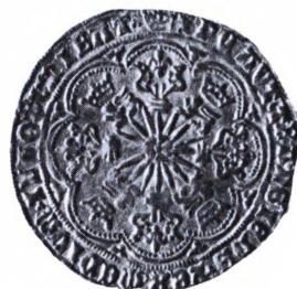
England, Edward IV (1461-1470): Rosenobel.

de vægten 120 grains (7,776 g). Der var en ret stor produktion af denne type i London, York, Bristol, Coventry og Norwich, men den varede ikke længe og sluttede før 1470. Under Henrik VII er der en kort tid i 1489-1490 præget en rosenobel, som ikke havde en rose afbildet på skibssiden. En endnu sjældnere rosenobel er Marys fra 1553, som gjaldt 15 shillings, og sidst er den under Elizabeth I udmøntet mellem 1583 og 1600, omend sjældent. Rosenoblen blev efterlignet i Nederlandene og var langt op i tiden så populær, at vægtlodder til denne mønttype fandtes i større møntvægtsæt til slutningen af 1600-tallet. I Sverige er der under Johan III i 1576 og 1585/86 præget dobbelt rosenobel stykker, der alle er meget sjældne.