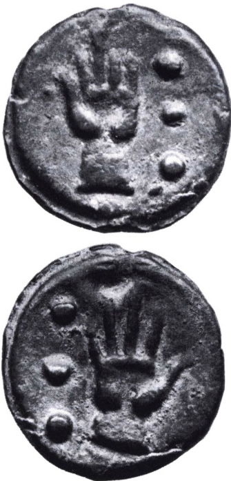
Romerriget: Quadrans 269-266 f.Kr.

Quadrans. Romersk bronzemønt=1/4 as. Assen deltes i 12 unciae; 1/4 as (quadrans)=3 unciae, hvilket på mønterne fra republiktiden angaves ved 3 store punkter. De tidligste quadranser vejede op til 80 g, men vægten faldt med jævne mellemrum