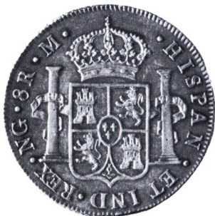
Guatemala, Carlos IV (1788-1808): 8 Realer 1796.

let gik det tilbage for denne. Sidste real prægedes af Guatemala 1912 i kobbernikkel. På Sardinien, som 1297-1720 var under spansk kontrol, har man, efter at øen kom under Huset Savoyen, brugt det gamle møntnavn real (reale) for 5 soldi stykket