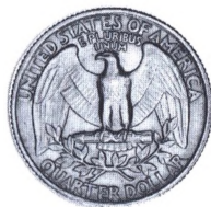
Amerikansk 1/4 dollar (quarter) fra 1978.

QUAR. DOL. Mønten var indtil 1964 i sølv og er siden præget i kobbernikkel.