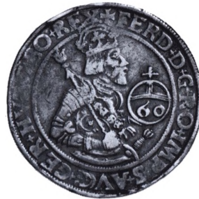
Freiburg: Gulddentaler (Reichgulddiner) 1565.

mange områder i Nord-, Midt- og Vesttyskland modsatte sig denne mønttype og holdt fast ved den tungere taler (daler). I den sydvestlige del af riget fortsatte udmøntningen. Fra 1566 blev den afløst som hovedsølvmønt af taleren (→ Reichstaler). Reichgulddiner kaldes også for gulddentaler.