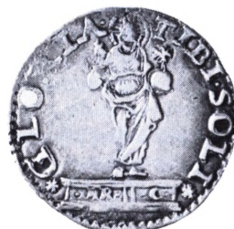
Venedig, Andrea Gritti (1523-1538): Lire u.år.