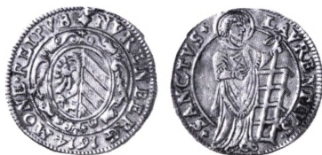
Nürnberg: Laurentiusguldgylden 1614.

Laurentius guldgylden. Guldgylden, der kun holdt 19 karat (0.792) præget fra ca. 1419 til 1600-tallet i