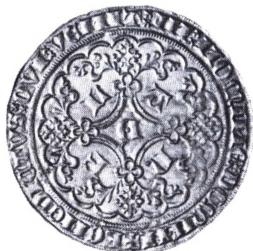
Flandern, Louis de Male (1346-1384): Lion heaume u.år.

Lion heaume. Flandersk guldmønt indført af Louis de Male (1346-1384). Mønten har sit navn fra forsiden's motiv med en hjælmet løve under en gotisk baldakin. På flamsk kaldes denne mønt ofte gouden leeuw eller slet og ret leeuw.