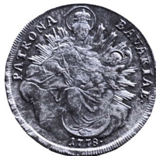
Bayern, Carl Theodor (1777-1799): Madonnadaler 1778.