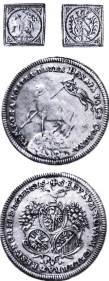
Nürnberg: 1/3 lammedukat klipning samt dobbelt lammedukat år 1700.

Lakajmedaljen → Medaljer-belønningsm.etc.