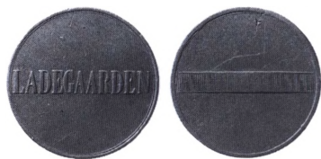
Så kaldt ladegårdsspecie.

Ladegårdsspecie. Navnet på et dansk pengetegn anvendt af fattiglemmerne på Ladegården, der havde navn efter Ladegårdsåen ved Åboulevarden i København. Ladegårdslammerne drog hver morgen ud for at feje Københavns gader. De var klædt i aflagte soldater uniformer og kaldtes også »Den 41. Bataljon«. Hæren bestod dengang af 40 bataljoner. Ladegårdsspecien, som det lille pengetegn kaldes, blev brugt til aflønning af overtidsarbejde for lemmerne i første klasse. Den gjaldt efter 1856 for 1 skilling og fra