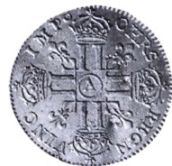
Frankrig, Louis XIV (1643-1715): Louis (a la tete virile) 1679.

10 livres, og den blev bibeholdt som regnings louis d'or eller regnemønt, da udmøntningsforholdet, især 1709-26, ændredes flere gange. 1792-93 udmøntedes de såkaldte konstitutionelle »louis de 24 livres«. Kongens portræt er stadig på forsiden, medens bagsidens motiv er opbygget i revolutionens ånd. En ny type 1793, præget efter kongens halshugning, har den tidligere bagside som forside, medens bagsiden består af en krans, hvori ses værdiangivelsen 24 livres. Begge mønter vejede 7,6 g og havde finheden 0,900.