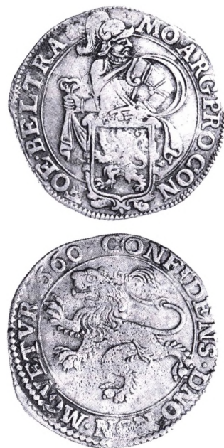
Nordlige Nederlande, Utrecht: Løvedaler (Leeuwendaalder) 1660.

Løvedaler. Talermonet præget fra 1576 (prøvemønt fra 1575) i provinsen Holland. Møntens navn var leeuwendaalder og skulle gå for 32 stuiver. Dens indre værdi var dog 3 stuiver mindre. Denne difference skulle tjene som gevinst til fordel for befrielseskrigen. Møntens vægt var 27,648 g, finheden 0.750 og finvægten 20,736 g. Forsidens motiv var en harniskklædt ridder og Hol-