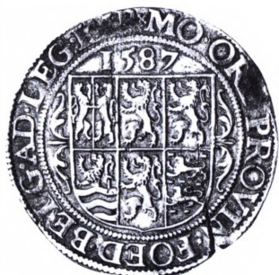
Nordlige Nederlande, Holland: Leicester Reichstaler 1587.

Leicesterrijksdaalder. Nederlandske daler mønt opkaldt efter den engelske jarl Robert af Leicester, der 1585 var kommet til Holland for at deltage i frihedskampen mod spanierne. Forordningen om denne mønt blev givet 4. aug. 1586, og vægten var ca. 29 g. På forsiden et brystbillede og omskriften: CONCORDIA RES PARVAE CRESCVNT og på bagsiden et våbenskjold med de 6 provinsvåben.