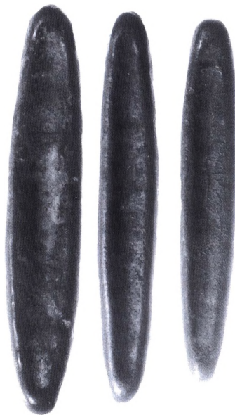
Kobber lats (kanopenge) udsendt i Luang Prabang i 1700 og 1800-tallet.

Lat. Navnet på metalbarrer brugt som betalingsmiddel af Lao staterne i Laos og det nordlige Siam (Thailand). Sådanne barrer anvendtes først i Lanchang 1353-1571. Det var langstrakte ovale billonbarrer, glatte i overfladen og med indstemplet elefantmærke. 1525-1571 udsendte Vien-