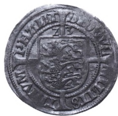
Lejrskilling 1523 præget under Frederik 1. (1523-1533), (G.51).

har været foreslået som prægested. Mønten efterlignede de dobbeltskillinge, som Fr.1. havde præget i Husum siden 1514, men den var en del dårligere. Omskriften afspejler klart situationen med det fromme ønske: DEO DVCE MILITES TRIVMPHANT (Med Gud som fører sejrer soldaterne).