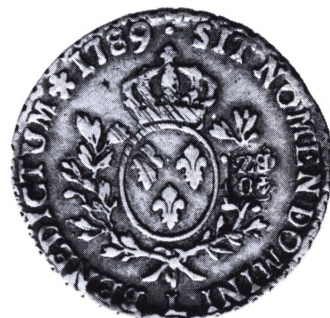
Schweiz, Bern: Fransk »laubtaler« 1789 med Berns kontramarkering for 40 batzen.

en laurbærkrans. Denne mønt var indtil midt i 1700-tallet en vigtig sølvhandelsmønt i Sydvesttyskland.