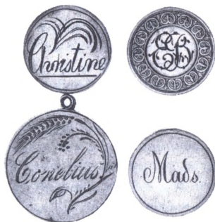
Skandinaviske mønter med indgravninger. 3 danske 25 ører (1874-1911) og en svensk 50 øre ST (1875).

langt billigere end at købe en præfremstillet medaljon til at gravere i. På stykket graveredes navnet (ofte fornavn eller kælenavn). Mange af stykkerne bærer også kunstfærdigt udfærdigede initialer eller mono-