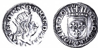
Italien, Toskana, Ferdinando II de Medici (1621-1670): Luigino 1660.

Luigino. Almindeligt øgenavn for det franske sølv 5 sols stykke, der oprindeligt blev præget fra 1643 under