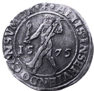
Braunschweig-Wolfenbüttel, Julius (1568-1589): Lichttaler 1575 fra Goslar.

stor trækølle i venstre hånd og et lys i højre hånd. De har en latinsk inskription: ALIIS INSERVIENDO CONSUMOR, der betyder: »I tjeneste for andre fortærer jeg mig selv. Lysdalerne blev afløst af → brilledalerne.