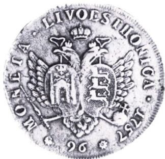
Rusland, Elisabeth Petrovna (1741-1762): Livonaise (96 kopek) 1757.

Livland og Estland og omskriften: MONETA LIVOESTHONICA. Forsiden havde et portræt af Elizabeth og omskrift med latinske bogstaver. Der er også præget 4 kopek (1,09 g 0.750) og 2 Kopek (1,05 g 0.396). Disse har en kronet dobbelt-