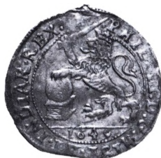
Tournai, Philipp IV af Spanien (1621-1665): Lion d'or (souverain) 1649.

Lion d'or. Fransk guldmønt indført 31. okt. 1338 under Filip VI (1328-1350) med en vægt på ca. 4,7-4,9 g. Forsiden viser kongen siddende i en gotisk tronstol med en liggende løve ved foden. Typen blev kopieret i Flan-tern og Nederlandene, hvor mønten gik under navne som → leeuw eller