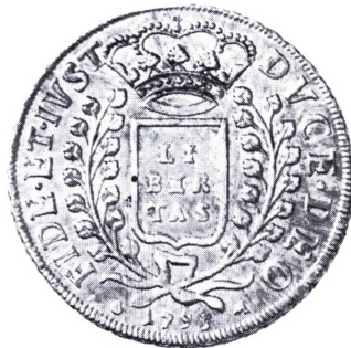
Italien, Ragusa: Libertina (2 ducati) 1793.