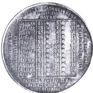
To forskellige typer kalendermedaljer.

En anden type viste evighedskalendere bestående af 3 skiver. De 2 yderste var som regel af messing, medens den midterste del var af et lyst metal, f.eks. sølv eller forniklet messing. De to yderste skiver havde udskæringer og ruder, hvorigennem tallene, der var indgraveret eller præget på den midterste del, kunne ses. Herved kunne aflæses dagens længde, tidspunktet for solens opstigen og nedgang etc.