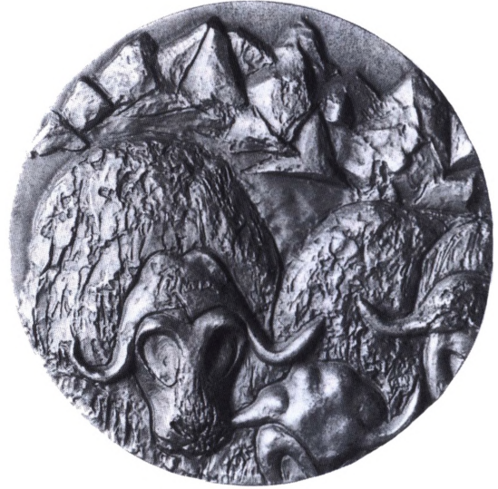
Moderne dansk kunstmedalje – den såkaldte Grønlands medalje 1973 fremstillet af firmaet Anders Nyborg.

6.årg.(1979) nr.1-2 og 7.årg.(1980) nr.1. Fra 7.årg.(1980) nr.2 skiftedes til det mindre A5-format, der udkom med 8.årg.(1981) nr.1-2 og 9.årg.(1982) nr.1-2. Sidste nummer er 10.årg.(1983) maj måned. Alle medaljer udkommet fra Anders Nyborgs Forlag er illustreret og beskrevet, ligesom der berettes om de skiftende nordiske kunstnere bag medaljerne.