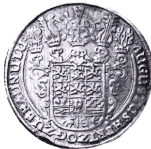
Braunschweig-Lüneburg, August d. Yngre (1635-1666): 7. Klokkedaler 1643.

en stor klokke. De seks første bærer desuden hertugens valgsprog: ALLES MIT BEDACHT. Der findes også halve og kvarte K.