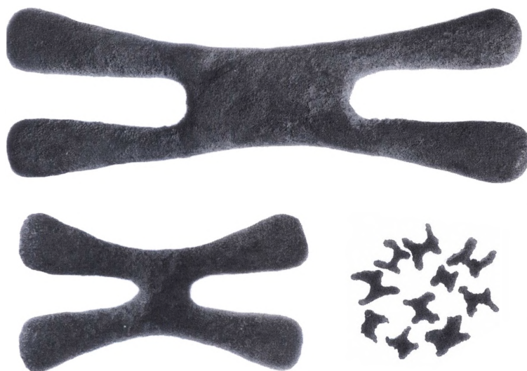
Forskellige størrelser af katangakors.

grave. Brugen af dette betalingsmiddel kan derved føres tilbage til den »Kisale periode« i 600 til 800-tallet. Katangakors findes i mange størrelser og udformninger, lige fra små stykker på en centimeters længde til store kors med en vægt på op til ca. 1,3 kg. Den mest almindelige gennemsnits-størrelse har en armlængde på ca. 23 cm, vejer ca. 870 g, og er støbt indtil et godt stykke ind i 1900-tallet. Kobberet blev oprindelig lokalt udvundet, men en stor del er se-