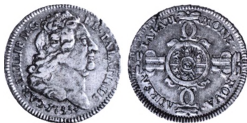
Pfalz-Neuburg, Karl Philipp (1716-1742): 1/2 Karolin 1733.

Karolin. Betegnelse for forskellige mønter af guld og sølv fra både Sverige og Tyskland. De svenske mønter havde deres navn fra kongerne Karl IX, XI og XII, idet Karl på la-