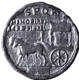
Romerriget, Agrippina Maior: Kontorniat præget ca. 355-361 e.Kr.

Kontrafejer (contrafejer). Siden medaljekunstens udvikling i Italien i 1400-tallet har danske konger haft kunstnere til at udføre medaljer for sig. Tidligt uddeltes medaljer som skuepenge, men med syvårskrigen (1563-70) indførte Fr.2. den skik at uddele støbte contrafejer (medaljer med kongens portræt) som nådestegn (gnadenpfennig). Kunstneren skar enten en original medalje, som resten støbtes efter, eller han fremstillede faste støbformer, som i datiden kaldtes »flasker«, og som kunne bruges mange gange. Ofte blev contrafejerne efterciserede, undertiden emaljerede og som regel forsynede med øsken, så de kunne bæres i en guldkæde. Contrafejer blev bl.a. medtaget på rejser og uddelt til kongelige og andre højtstående personer. Kontrafejerne var en forløber for ordensvæsenet, dvs. tildeling af ordner og dekorationer.