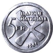
Katanga: 5 Francs 1961 med afbildning af et katangakorset.

Lit: Nicole Raes: Les croisettes de cuivre en Afrique Centrale, Bruxelles 1986-87, 161 sider (udførlig bibliografi); R.Denk: Die verschiedende Formen der sog. Katanga Kreuze, EUCOPRIMO Heft 16 1985 s.3-28 (udførlig bibliografi) samt EUCOPRIMO Heft 24 1988 s.57-58; MK 1979 s.45.