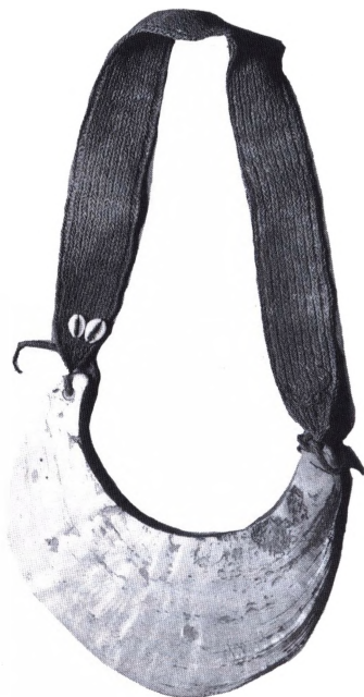
Kina muslingeskalpenge (bredde ca. 20 cm).

Kipper- og Wippertiden. I den tyske historie findes flere perioder med møntforringelser. En af de værste var perioden kendt som K. og W. Den begyndte med 30-årskrigen i 1618 og endte 1623. Årsagen var en for lille udmøntning af sølvmønter allerede i årtier før, fordi selv prægning af skillelønt, på trods af en slet møntfod, var urentabel. En mængde fyrster lod foretage den ene emission efter den anden, og mønterne blev hele tiden ringere: de såkaldte → »heckenmünzen«. Ved 30-års krigen begyndelse var småmøn-