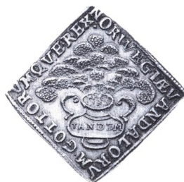
Dansk 1/4 speciedaler 1648 der udkastedes blandt folket i København ved Frederik 3.'s kroning.

XIV Johan's begravelse 1844. I Sverige findes ca. 25 forskellige kastepenninge med møntkarakter.