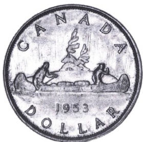
Canadisk sølv kano dollar fra 1953.

kano. Indtil 1966 blev dollaren præget i sølv med finheden 0.800, men fra 1968 er den præget i kobbernikkel med en diameter på 32 mm.