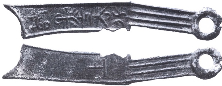
Knivmønt fra Jimo (Shantung Prov.) i det 7. årh. f.Kr. (Shanghai Encp. 1565). Længde 154 mm.