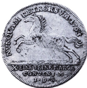
Braunschweig-Wolfenbüttel, Karl I (1735-1780): Konventionstaler 1765.

dobbelte, halve og kvarte med angivelse V, XX eller XL eine feine mark. I 1800-tallets begyndelse var konventionstaler og → kronentaler de betydeligste større sølvmønter. I Østrig blev den præget indtil 1857 (C.209), hvor den blev afløst af → vereinstaler, der var 1/2 florin mindre værd. Som følge af forskellige tyske møntunioner og møntreformer forsvandt K. i Tyskland i løbet af 1830'erne. I regnskaber og mønttabeller er forkortelsen for denne mønt Conft. eller Cfl.