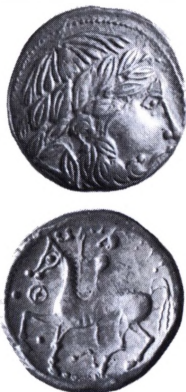
Donaukelterne: Tetradrakme, Subkarpatisk prægning 2.-1. årh. f.Kr.

en rytter. Denne type efterprægedes og spredtes mod nordvest op til Rhinen. I Podalen har kelterne præget mønter så sent som 80 f.Kr. Her var det drachmer fra den græske koloni