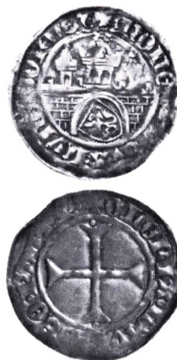
Lüneburg: Kreuzgroschen u.år.

Kreuzgroschen. En art → meissengroschen præget siden 1369 af markgreve Friedrich III og efter 1378 af Balthasar af Thüringen. Markgreve Wilhelm I (1381-1407) fortsatte udmøntningen, hvorefter den blev afløst af → schildgroschen. Af disse senere groschentyper er en variant udmøntet af Friedrich II sammen med Friedrich dem Friedfertigen og Sigismund mellem 1428 og 1431.