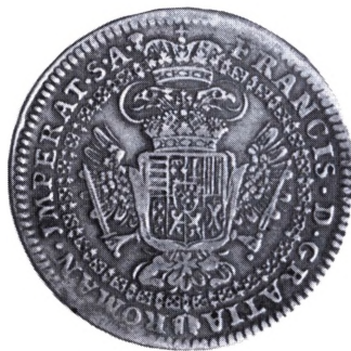
Østrigske Nederlande, Franz I (1745-1765): Kronentaler 1758 (Bruxelles).

og finvægten 25,9 g. Typen blev hurtigt populær i det vestlige Tyskland, og fra 1810 til 1837 prægede en ræk-