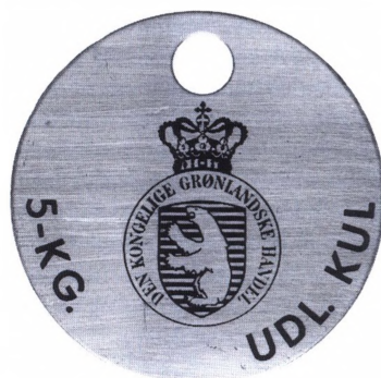
Grønlandsk kultegn gældende for 5 kg. udenlandsk kul (50,1 mm).

Kultegn. Specielle tegn anvendt i Grønland ved udlevering af kul. I begyndelsen brugte man trætegn, men fra 1964 tog man nogle messingtegn i brug. Af disse havde