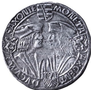
Kurfyrstedømmet Sachsen, Friedrich III, Johann & Georg (1507-1525): Klappmützentaler u.år.

dede hertugers hovedbeklædning (klappmütz). Disse mønter var i øvrigt de første vægtige sølvmønter i taler størrelse, som blev præget i anseelig mængde.