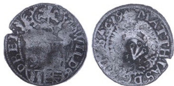
Dobbeltschilling 1619 fra Branuschweig-Harburg kontramarkeret med Stralsunds mærke (stråler).

tramarkering er næsten altid en erstatningsmønt, ellers ville man have præget en ny mønt. Kontramarkering har været kendt allerede af grækere og romere i antikken, og området, der er meget stort, kan opdeles i to hovedgrupper: Officielle og private kontramarkeringer. Inden for de officielle kontramarkeringer er der en skarp opdeling af, om det er