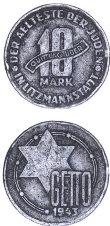
10 mark koncentrationslejrmonter af aluminium eller magnesium fra 1943.

koncentrationslejre under 2. verdenskrig. De hyppigst fremkomne blandt samlere er 1943 serien fra Litzmann-