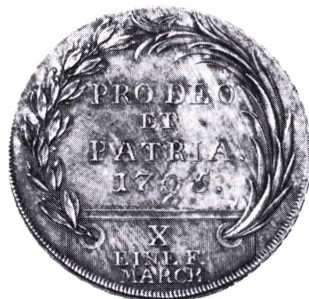
Fulda (bispedomme), Adalbert von Harstall (1788-1802): Kontributionstaler 1795.

f.eks. PRO DEO ET PATRIA (for Gud og fædreland). En dansk parallel har vi i Fr.6.'s 1/6 rigsdaler 1808, den såkaldte → offermark, der også blev præget af frivilligt indsamlet sølv. Den bærer teksten »Frivilligt offer til Fædrelandet«.