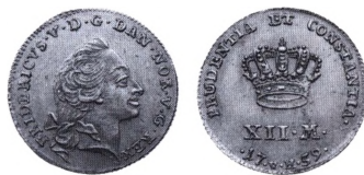
Kurantdukat 1759 udmøntet under Frederik 5. (1746-1766) (H.22C).

Kurantdukat. Dansk guldmønt udmøntet 1714-16 under Fr.4. som et 2 rigsdaler kurant-stykke. Mønten vejede 2,870 g med finhed 0,875, blev 1727 nedsat fra 12 til 11 mark og indkaldtes 1757, da Fr.5. udsendte sine kurantdukater, der vejede 3,118