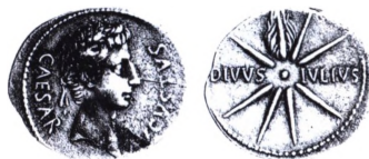
Romerriget, Augustus (31 f.Kr.-14 e.Kr.): Denar (19-18 f.Kr.), bagside med komet.

Kometmønter. Forskellige himmel-fænomener, som f.eks. kometer, super novaer etc., har gennem tiderne også sat sig spor i numismatikken. Allerede på romerske mønter findes afbildninger af kometer. En super nova er afbildet på en byzantinsk