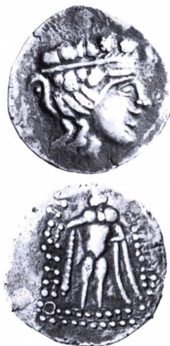
Keltisk imitation af Taso tetradrakme (3.-2.årh. f.Kr).

Keltiske mønter. Om det keltiske folks oprindelse har man kun få oplysninger, men fra 5.årh. f.Kr. er de nævnt i græske og romerske skrifter. Det synes, som om de er kommet fra området lige nord for Alperne, dvs. Schweiz og Østrig. Herfra drog stammer ca. 600 f.Kr. mod vest og havnede i Spanien. Andre stammer drog 400 f.Kr. mod nord til Britannien, medens atter andre vandrede over Alperne mod syd og angreb Rom 390 f.Kr. De blev slået tilbage og nedsatte sig i Podalen, hvorfra de