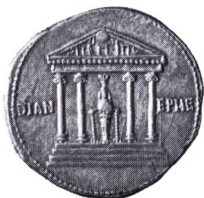
Romerriget, Claudius (41-54): Kistofor (3 denarer).

vedsagelig i omløb inden for kongeriget Pergamons interesseområde, og da dette rige ved arv i 133 f.Kr. overgik til Rom, fortsatte romerne med udmøntninger af kistofor for denne provins – kaldt Asia – helt op til Septimus Severus og Julia Domna (193-211) samt Caracalla (198-217).