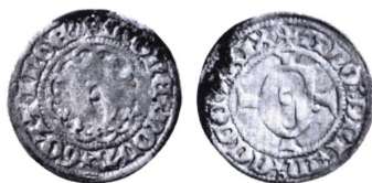
Göttingen: Körtling 1429.

Körtling. Lille tysk billonmønt fra Würzburg. Mønten er præget 1751