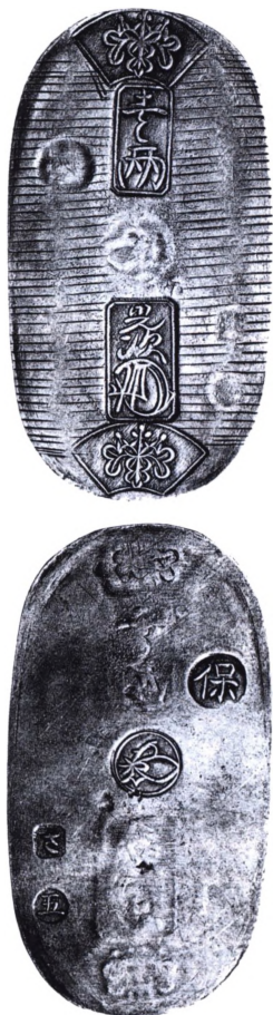
Japan, Tempo perioden (1837-1858): Koban u.år.

Koban (Coban). Helt op til Bunroku Era (1592-1595) brugte man i Japan guldstøv som betalingsmiddel. Det blev opbevaret i brokadepunge eller i bambusrør, der var lette at transportere. I det 4. år af Bunroku,