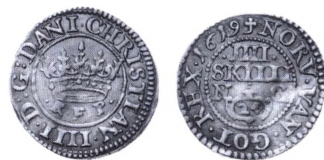
Christian 4. (1588-1648): 4 Kroneskilling 1619 (H.111A).

Kroneskilling. Betegnelse for danske 8, 4, 2 og 1 skilling, der efter kronemøntens indførelse 1618 blev udsendt 1619-20 (Hede:110-117). Oprindeligt var kronen tænkt at skulle gælde 1 1/2 daler, og man valgte at dele kronen i 96 skilling. Det fremgår af møntens design, idet den på bagsiden havde en lille oval, hvori et tal angav dens andel af kronen: 12 dvs. 1/12 og så fremdeles med 1/24, 1/48 og 1/96. Paradoksalt nok havde mønterne samtidig værdibetegnelse