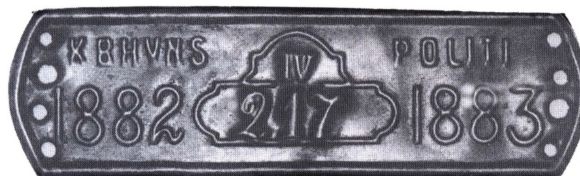
Ældre københavnsk messing hundetegn fra 1882/1883.

Kynesematologi er »læren« om hundetegn. Sådanne tegn samles undertiden af dem, der beskæftiger sig med medaljer, jetons, poletter etc.