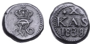
10 Kas 1838 udmøntet i den danske koloni Trankebar under Frederik 4. (1808-1839).

Kas (Cas). Møntenhed brugt ca. 1620-1845 i den danske koloni Trankebar på Indiens sydøstlige kyst. De første kas med årstal er af bly præget 1637. Bortset fra en enkelt kobberkas-udmøntning 1667 skal man frem til 1688, før der kommer en regulær kobberudmøntning, og bly-