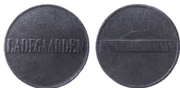
Så kaldt ladegårdsspecie.

Ladegårdsspecie. Navnet på et dansk pengetegn anvendt af fattiglemmerne på Ladegården, der havde navn efter Ladegårdsåen ved Åboulevarden i København. Ladegårdslammerne drog hver morgen ud for at feje Københavns gader. De var klædt i aflagte soldater uniformer og kaldtes også »Den 41. Bataljon«. Hæren bestod dengang af 40 bataljoner. Ladegårdsspecien, som det lille pengetegn kaldes, blev brugt til aflønning af overtidsarbejde for lemmerne i første klasse. Den gjaldt efter 1856 for 1 skilling og fra