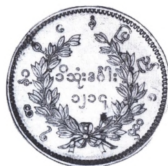
Burma (Myanmar): 1 Kyat 1852 i sølv.

eller 5 mat=8 eller 10 mu; idet 1 kyat oprindeligt gjaldt 10 lette mu og senere 8 tunge mu. 1 mu=2 pe= 8 pyas. Sølv-kyat fra 1852 vejer 11,66 g med finhed 0,917, medens et par andre kyats fra 1852-53 og 60 vejer henholdsvis 16,23 16,45 og 15,75 g. Ved decimalsystemets indførelse 1952 blev 1 kyat=100 pyas, og møntmetallet kobbernikkel.