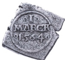
1 mark klipping 1564 udmøntet i København under Frederik 2. (1559-1588). (H.14A).

erne 2 mark, 8 og 4 skilling. En række af Fr.2.'s mønter fra 1563-66 er ligeledes præget som klippinge.