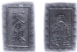
Ichibu gin fra Tempo perioden (1837-1854).

Ichibu-gin. Rektangulær japansk sølv mønt. Ichi er japansk for een; bu var tidligere en vægtenhed på ca. 8,64 g, men betyder egentlig »del«, og gin betyder sølv. Mønten er præget i tre perioder med faldende finhed: Tempo perioden (1837-54) med finhed 0,991; Ansei (1859-68) med