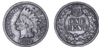
USA 1 cent 1887 (Indian Head type).

Indian Head Cent. Populært navn for den amerikanske cent, der 1859 blev introduceret med et indianerhoved på forsiden. Fra 1859-1864 var mønten af kobbernikkel, men 1864-1909 blev den præget i bronze. 1909 afløstes den af en cent med afbildning af Lincoln. 5 cent (nickel) mønten 1913-1918 var også forsynet