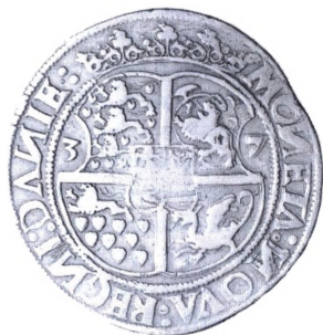
Dansk joachimsdaler 1537 præget i København under Christian 3. (1534-1559).

guldengroschen mønt, som første gang blev præget i Tyrol af ærkeherzog Sigismund 1484, og som i øvrigt var forbillede for de danske → sølvgylde. Joachimsdaleren efterlignede de saksiske guldengroschen (→ klappmützentaler) med hensyn til vægt og finhed. På forsiden sås den hellige Joachim, der ifølge en ikke bibelsk tradition var far til jomfru Maria, medens bagsiden viser den dobbelthalede kronede bøhmiske løve. Mønterne kaldtes også »joachimstaler grossen groschen«, kortere »thaler groschen« og til slut blot thaler eller taler (daler). Disse schlieske Joachimstalere er præget til 1528 til et beløb af ca. 2,2 mio. talere, heri inkluderet de halve, kvarte og dobbelte talere. Aflædninger af ordet taler er brugt i mange lande som betegnelse for en stor sølv mønt på ca. 30 g. → Daler