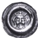
Svensk hulpenning præget i Stockholm under Albrekt af Meklenborg (1363-1389, 1395).

Hulpenninge. Betegnelse for senmiddelalderlige små → brakteater særlig præget i Nordtyskland. Især i 1300-tallet var der en stor produktion i Lübeck, Hamburg og Mecklenburg, og de spillede en betydelig rolle som småmønt i Danmark til slutningen af 1500-tallet. Det største