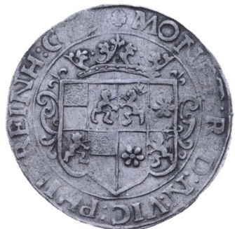
Christian 4. (1588-1648): Speciedaler 1627 fra Wolfenbüttel (H.3B).