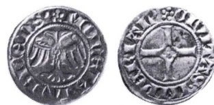
Lübeck: Witten (4 pfennig) for 1379.

Hvid. En lille sølvmønt først præget i Nordtyskland fra omkring 1360. Fra begyndelsen havde mønten en vægt på ca. 1,3 g med en finvægt på ca.1,1 g. Mønten var således af godt sølv, dvs. sølv hvori der ikke var blandet for meget kobber, og den så derfor lys eller hvid ud – deraf nav-