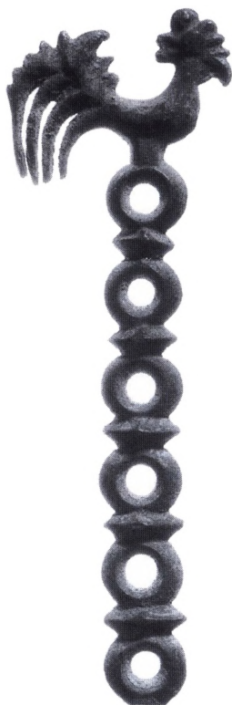
Tinhanemønt fra Kedah i Malaya.

Hanemønt . Sultan Muhamed Jiwa Zainal Abidin Muazzam Shah (1710-1773) indførte i Kedah i Malaya tindyremønter i form af en kamphane hvorunder et antal ringe, normalt 6. Fra de få oplysninger, der er til rådighed, ved man, at hanen selv var 5 cent af en spansk dollar værd, mens hver af de tilsluttede ringe havde en værdi af 1 cent stykket. Nogle få af disse tin hanemønter var stadig i cirkulation så sent som i 1850'erne, hvor hver ring havde en værdi af 10 stykker af Singapore-købmændenes »one keping token«.