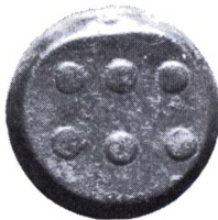
Sicilien, Himera: Hemilitron ca. 445-430 f.Kr.

f.Kr. blev den præget som bronzemønt af mange sicilianske byer.