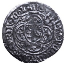
Sachsen (hertugdømme), Wilhelm III (1445-1482): Judenkopfgroschen.