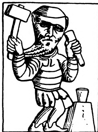
Hammerprægning fra 1000-tallet. Tegning af et relief på en søjlekapitel i en nordfransk kirke, Saint-Georges de Boucherville i Normandiet.

Hammerprægning er den ældste møntproduktionsmetode. Den var anvendt indtil midten af 1500-tallet, da maskinerne til prægning gradvist blev indført, og endnu ind i 1700-tallet kan man flere steder fastslå, at hammerprægning har været anvendt. Understemplet sad fast i en ambolt eller en stor træblok. På understemplet lagde man en → blanket, hvorefter man placerede over-