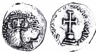
Byzans, Constans II og Constantinus IV (654-659): Hexagrammon.

Hexagrammon. Byzantinsk sølv-mønt indført 615 under Heraclius (610-641). Mønten skulle veje 6 scripulæ (6,85 g) og være en dobbelt → miliaense (miliaresion). 1 H. = 1/12 solidus (2 karat guld), 2H. = 1/2 → tremissis. Udmøntningen synes at være et forsøg på → bimetalisme med et forhold mellem guld og sølv på 1:18. Mønten kom til som følge af nøden under perserkrigene og udmøntedes i store mængder af kejserligt sølv og senere også af nedsmeltede kirkeskatte. Mønten blev slået næsten regelmæssigt i ca. 70 år og ophørte som kurantmønt ved fredsaft slutningen 678. Der er ganske vist præget sølv-mønter efter dette tidspunkt, men kun i begrænset mæng-