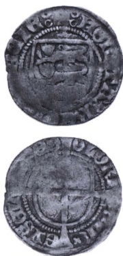
Dansk skilling udmøntet under Rigsrådet (6.jan.-28. sept. 1448) i Malmö (G.21).

Interregnums-mønter. Betegnelse for mønter slået i kongeløse tider. Blandt de danske er Rigsrådets udmøntninger af hvide og skillinge 1448 samt 2 skillingen 1533. Hviden, der traditionelt er henført til 1448, menes ifølge nyeste teser at være fra 1481-83. I Sverige er udsendt interregnumsmønter 1465-67 og i Norge en dobbelthvid 1523-24 mellem Chr.2.'s afsættelse og Fr.1.'s tiltræden. Disse sid-