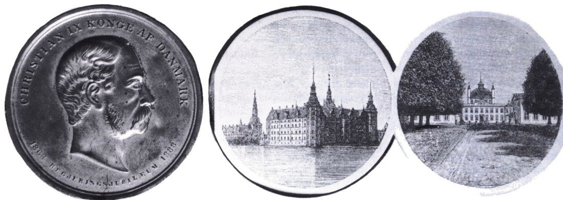
Hulmedalje fra den nordiske industri-, landbrugs- og kunstudstilling 1888 i København (formindsket gengivelse).

Hulmønter. Mønter der, i modsætning til senere gennemhullede stykker, har fået hullet ved møntens prægning eller ved blankettens fremstilling. De tidligst kendte hulmønter er de kinesiske cash, hvor hullet havde to formål. Dels kunne mønterne trækkes på snor til en streng bestående af 50, 100 eller flere mønter, og ved fremstilling af støbte cash mønter, skubbede man dem på en firkantet pind, så de ikke drejede, når man filede støbegraterne til. I nyere tid har man brugt hullet som en hjælp til at skille møntværdier fra hinanden – en hjælp til svagtsende og blinde.