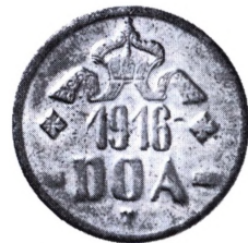
Tysk Østafrika: 20 Heller 1916.

helleren siden ca. 1690 blev præget i rent kobber. Bayern, Frankfurt og Hessen var de sidste, der prægede denne mønt, der var lig 1/2 kreuzer eller 1/2 pf.