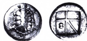
Ægina: Drakme ca. 380 f.Kr. Bagside med incusum.

Inkuse mønter. Mønter, hvor forsidens billede ses fordybet på bagsiden. Til at præge sådanne mønter havde man et normalt forsidestempel i negativ samt et bagsidestempel i positiv, dog en anelse mindre, så der var plads til materialet. Denne prægemetode var meget anvendt i de græske byer i Syditalien i den arkaiske periode ca. 550-475 f.Kr. I den første tid var forside- og bagsidestempel stort set ens, bortset fra at den ene var i negativ og den anden