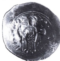
Byzantisk histamenon nomisma (guldskyfat) fra Constantin X (1059-1067).

heden af, at de var bestemt for de nyerebrede områder i Syrien, hvor den fatamidiske denar havde cirkuleret. Den var lettere end H. Denne prægedes helt til Alexius I's reform i 1092, da den blev afløst af → hyperpyron. I slutningen af sin tid var den dog blevet forringet ved tilsætning af sølv. I begyndelsen havde mønten størrelse som en solidus, men efterhånden blev blanketterne større og tyndere, og til sidst var man nødt til at præge dem skålførmede (skyfate) for at stive dem af.