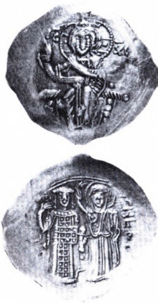
Byzans, Alexius III (1195-1203): Hyperpyron.

Håvikfundet. Et af de største norske dalerfund kommet for dagen