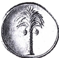
Zeugotania, Karthago: Guld hexadrachme ca. 256 f.Kr.

være trishekels, og en guldudmøntning fra Demetrius I fra Syrien menes at være slået som attisk pentadrachme.