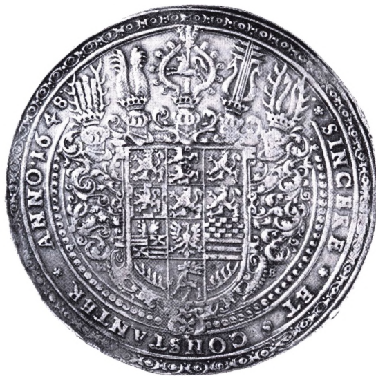
Lüneburg-Celle, Christian Ludwig (1648-1665); Löser (Juliuslöser) til 2 reichstalers værdi.