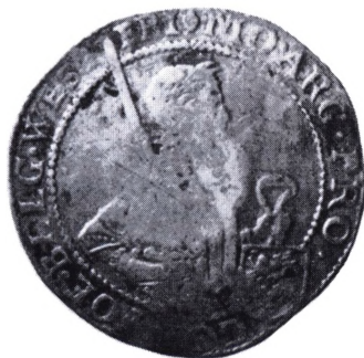
Rusland, Alexei Michailowitsch (1645-1676): Jefimok 1655 på taler fra 1619.