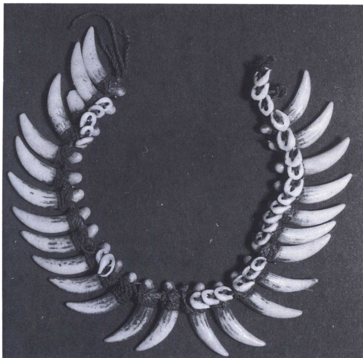
Hundetandskæde med europæiske imitationer i porcelæn.

ikke arbejdedes i så mange timer om dagen. Der findes også tegn for 24 skilling (rigsort) og 1 daler. Omkring juletid holdtes hovedopgør mellem husmanden og husbonden. Så blev de opsparede husmannspenge optalt og indløst med gangbar mønt.