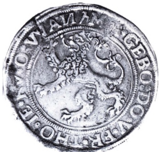
Jever, Maria (1536-1575): Jodocustaler u.år.

den jeverske løve, medens bagsiden har en afbildning af den hellige Jodocus.