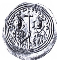
Byzans, Basilius II & Constantinus VIII (976-1025): Histamenon Nomisma (1005-1025).

vægt var 1/6 romersk ounce = 24 keratia (vægt karat) = 4,55 g. Dog vejer bevarede eksemplarer kun ca. 4,40 g. Samtidig prægedes en anden guldmønt: tetrateron nomisma, der var ca. 2 keratia (0,38 g) lettere. Da de første typer kun kan adskilles fra H. ved hjælp af vægt, har man heri set et forsøg på vinding fra statens side.