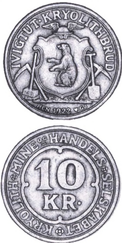
10 kr. i kobbernikkel med årstal 1922 men præget 1926.

Ivigtut. Lokalitet i Sydgrønland ved Grønvedal, hvor der fandtes kryolit, der kunne bruges som katalysator ved aluminiumfremstilling. I 1859 dannedes »Fabrikken Øresund«, som skulle stå for udvindingen i Grønland. Til brug for arbejderne, der alle var danske, anvendtes et sæt mønttegn i zink i værdierne 1 rigsdaler, 48, 16, 4 og 1 skilling. De bærer påskriften ØRESUND samt værdiangivelse og har været i brug 1859-1865. Da opstod et nyt selskab med navnet »Kryolith Mine og Handels Selskabet«. Mønttegn herfra er i zink, har indskriften IVIGTUT og