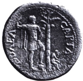
Romerriget, Vespasian (69-79): Sesterts af judaea capta type.

get mandshoved med en spids hue, som jøderne i middelalderen skulle have gået med. Mønten gjaldt 9 pf., og der gik 20 af dem på en rhinsk gylden.