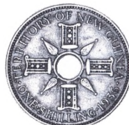
Ny Guinea 1 shilling 1936 med afbildning af en hundetandskæde, der tidligere spillede en stor rolle som betalingsmiddel.