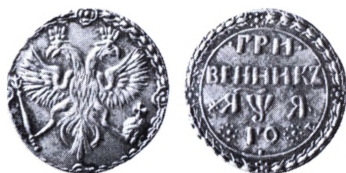
Rusland, Peter d.Store (1682-1725): Grivennik (10 kopek) 1701.

Grivennik er navnet på et russisk 10 kopek sølvstykke præget første gang 1701 under Peter den Store med en vægt på 2,84 g og finhed 0.729. Møntens navn er afledt af den gamle russiske barre- og regne-