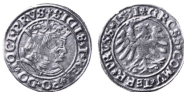
Polen, Sigismund I (1506-1548): Groschen 1531.

romanino, og 1266 udsendte Ludvig den Hellige (IX) en denarius tournois kaldet → gros tournois til 12 deniers værdi. Denne mønt blev en vigtig