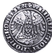
Luxemburg, Wenzel II (1383-1388): Gans (2 blan-gros).