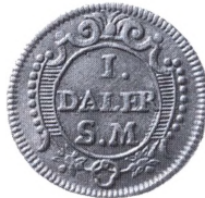
Så kaldt Görtzdaler (1 daler s.m. 1718) med Merkur som motiv.

slaget, men det blev Görtz, der måtte bøde med sit liv herfor og henrettedes uden rettergang. Der blev præget 10 forskellige typer af disse nødmønter eller kreditmønter, af samme værdi som 1 daler sølv-mønt=755,7 g kobber, og ialt ud-