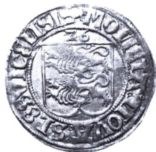
Dobbeltskilling 1526, Frederik 1. (1523-1533), Gottorp (G.124B).

ter her for Chr.3. Ifølge regnskaberne er der udmøntet klippinge med årstallet 1534, men sådanne kendes ikke i dag. Et par mønter (rhinsk gylden 1536 G.131 og dobbeltskilling 1536-37 G.132), der udgiver sig for at være slået i Slesvig, har vist sig at være præget i Roskilde og København.