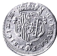
Neapel, Filippo V (1700-1707): Grano 1701.