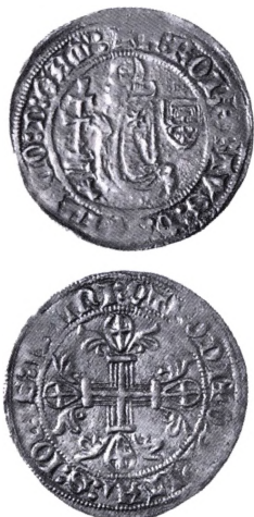
Johanitterordenen på Rhodos, Robert de Juilly (1374-1376): Gigliato.

Gigliato. Neapolitansk sølv mønt indført 1302 eller 1304 af Karl II af Anjou. Forsiden viser en tronende regent – bagsiden liljer i korsvinkler-