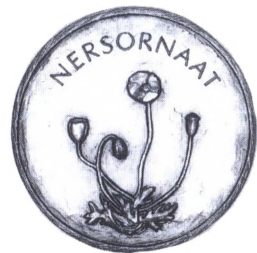
10 kr. 1932 udgivet til brug på den arktiske station i Thule. Nederst Grønlands fortjenstmedalje.

og værdierne 100, 50, 10, 5 og 1 øre og kom i flere serier. I 1910 oprettede polarforskeren Knud Rasmussen en arktisk station i Thule og lod i 1913 udsende mønter i værdierne 500, 100, 25 og 5 øre i aluminium. Mønterne er præget i Tyskland, hvorimod 5 og 10 krone mønterne med årstal 1932 er præget i København. Grønlands Minedrifts Aktiesel-