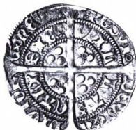
England, Henrik VI (1422-1461): Groat fra Calais.

franske → gros tournois. 1351 indførte Edward III en lettere på 4,66 g med en finvægt på ca. 4,3 g, og under Henry IV (1399-1413) var vægten dalet til 3,88 g. Denne vægt bibeholdtes til 1464, hvor den nåede helt ned på 2,88 g. Midt i 1600-tallet opførte udmøntningen, idet den blev erstattet af en 4 pence mønt. Den egentlige groat blev først indført igen 1836 som → britannia groat.