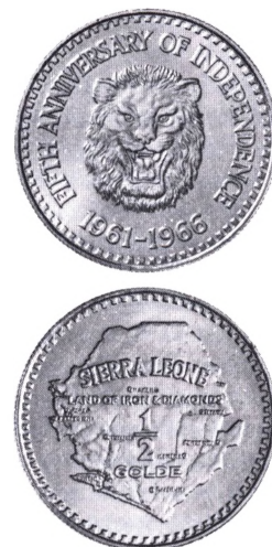
Sierra Leone: 1/2 Golde 1966.

Golde. Guldmøntenhed indført i Sierra Leone 1966 i forbindelse med