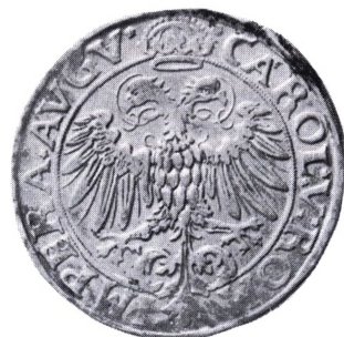
Würzburg (Bispedømme), Melchior Zobel von Giebelstadt 1544-1558): Guldiner 1554.

Guldiner. I Syd-tyskland og Schweiz kaldtes de store sølvmonter, der var ækvivalente med guldylden, for guldiner. I modsætning hertil kaldtes de tilsvarende mønter i Midt- og Nord-tyskland for → guldengroschen. I de habsburgske lande og deres interesseområder benyttes navnet guldiner indtil omkring midten af 1500-tallet, da man overgik til navnet → daler (taler).