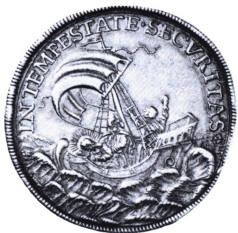
Kremnitz: Georgstaler u.år (ca. 1700).

mønter populære hos soldaterne. Mansfelder-dalerne 1521-23 havde indskriften: ORA PRO (nobis)(Bed for os), og på et par senere fra 1606-15 står: BEI GOT IST RATH UND TAHT. I Kremnitz slog man en type i dalerstørrelse, som i virkeligheden var en medalje med Skt. Georg på den ene side og Kristus i en båd på det oprørte hav på den anden side samt indskriften: IN TEMPESTATE SECVRITAS (sikkerhed i stormen). Den blev særlig populær blandt søfolk, og typen er siden og helt op i 1900-tallet præget i et utal af udgaver, størrelser og metaller.