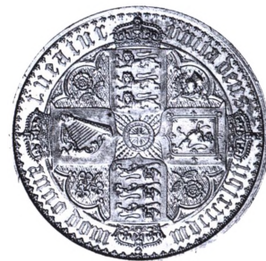
England, Victoria (1837-1901): Gothic Crown 1847.