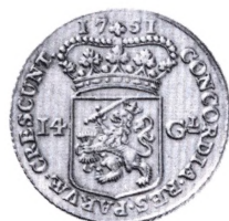
Holland: Gouden rjder (14 gulden) 1751.

den i Gelderland, Overijssel og Friesland bærer ogsa dette navn, og i Republikken var det sluttelig en 10 g tung guldmont med finhed 0.920. Kursen var i 1606 10 gylden og 2 styver, men en ny type 1749 fastsatte i praget vardien til 14 gylden. Denne er praget indtil 1763.