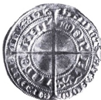
Luxemburg, Jobst von Mähren (1388-1402): Gans (2 blan-gros).

me nominal, selv om disse ikke havde en fugl som motiv.