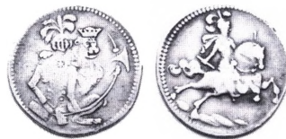
Sølvafslag af Gyldenløves dukat.

Gyldenløves dukat. I Chr.5.'s tid blev i Norge slået en række guldmønter. De fleste var regulære dukater, medens andre betegnes som en slags