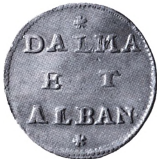
Republikken Venedig. Kobber-gazetta (2 soldi) 1684-1797 for områderne Dalmatien og Albanien.

en og Levanten. 10 gazette stykket kaldes også lironen, og senere stykker fra 1700-tallet kaldes lirazza. Værdien var dog ikke altid 10 G., men den aktuelle værdi i G. stod i romer-