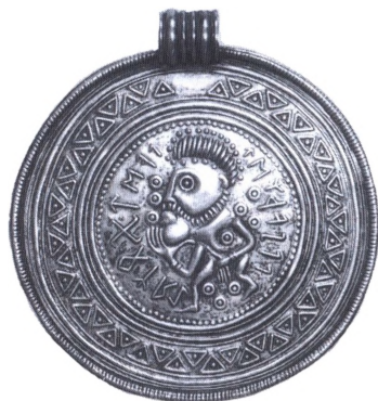
En såkaldt B-brakteat fra nordisk folkevandringstid forsynet med runeskrift.

Guldbrakteater. Smykkebrakteater af tyndt guldblik fra nordisk folke-