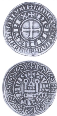
Gros tournois præget under Phillip d. Dristige (1270-1285).

Gros tournois (Turonensis argenti, Denarius grossus, Grossus turnus, Grossus albus eller Turnose). Fransk sølvmønt indført af Ludvig den Hellige 15. aug. 1266 til 12 deniers værdi og med en vægt på ca. 4,2 g. Forsiden havde et kors i midten med to