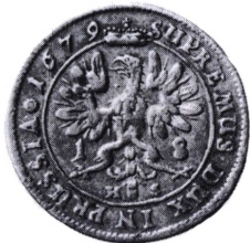
Brandenburg, Friedrich Wilhelm (1640-1688): 18 Gröschler 1679.

Guardein (Wardein) er betegnelsen for den embedsmand, der skulle påse, at udmøntninger var i overensstemmelse med møntordningen. Arbejdet bestod i at konstatere en mønts indhold af guld eller sølv og blev ofte betroet en guldsmed, der på dette område var fagmand. I Tyskland kendes virksomheden allerede fra 1300-tallet. Oprindeligt var der to mand om kontrollen, den, der bestemte finheden, og den, der forestod vejningerne. Disses arbejde blev snart slået sammen til et embede. Efter man i Danmark under Chr.4. havde indført → forpagtningsmønt, var det vigtigt, at guardeinen var uafhængig af møntmesteren, dvs. at han ikke måtte være lønnet af denne. Embedet var undertiden kombineret med kontrol af alt forarbejdet guld og sølv. → Remedium og Probering.