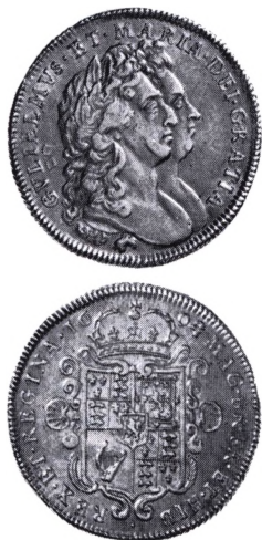
England, William & Mary (1688-1694): 2 Guineas 1694 (Seaby 2690).

mer af, at guldets til udmøntningen kom fra Afrikansk Guinea gennem det Afrikanske Compagni. Mønten havde en værdi af 20 shilling. På grund af stigning i guldets pris og