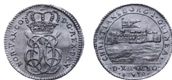
Dukat fra 1730 med afbildning af det danske fort Christiansborg i Guinea.

Guineadukater. Betegnelse for danske guldmønter med tilknytning til kolonitiden samt de danske forter i Guinea på Guldkysten i Afrika. 1657 præges den første guldmønt