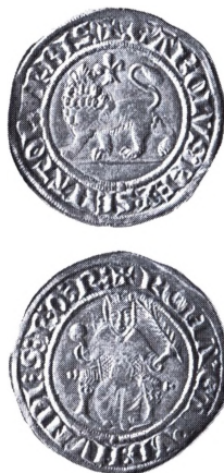
Italien, Rom, Carlo I d'Angio: Grosso (1270-1285).

Grosso. Italiensk møntenhed med betydningen stor eller bred og almen betegnelse for enhver mønt, der var større end en dobbelt denar. De første italienske grosso mønter var mindre end de senere. Blandt de første var denarius grosso fra Genova 1172, der vejede 1,46 g og havde en værdi af 4 genova denarer. Både Firenze, Cremona, Pavia, Mila-