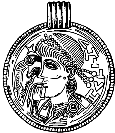
Fig. 7. A-brakteat fra Tjurkö, Augerums sogn, Blekinge (IK 183). 2:1. - A-bracteate from Tjurkö, Augerum parish, Blekinge (IK 183).

til et gravfund fra folkevandringstid (Nerman 1935 s. 7). Det er dog usikkert, og andre ting taler mod en typologisk udvikling fra medaillon-efterligninger til brakteater.