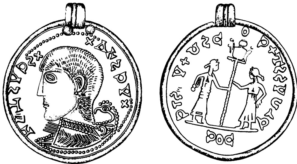
Fig. 1. Medaillon-efterligning fra Åk, Møre og Romsdal (IK 3), avers og revers. 2:1. –Medaillon imitation from Åk, Møre og Romsdal (IK 3), obverse and reverse. 2:1.

Magnentius og Decentius (350–53), og som er repræsenteret blandt de mønter, der er fundet i Gudme (Kromann 1987 Taf. XII). Endelig kan kejsernavnet Constans (337–50) genkendes i indskriften på IK 256 Godøy (Sunnmøre; Axboe 1981 nr. 12a) og måske på IK 263 Gunheim (Telemark; Mackeprang 1952 pl. 2:1).