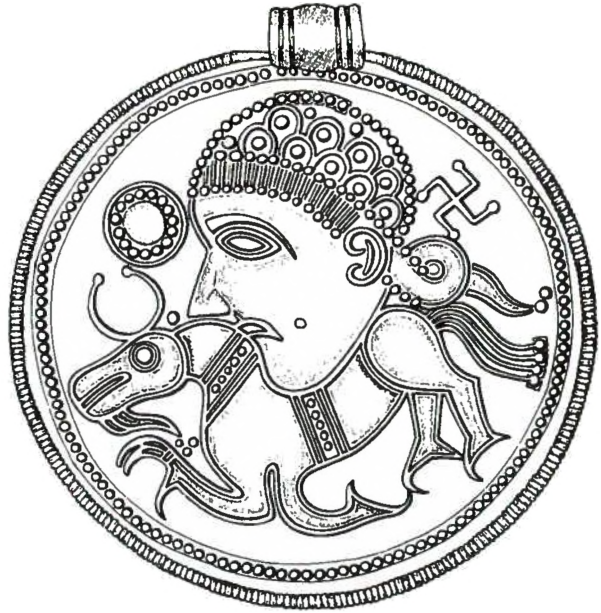
Fig. 5. C-brakteat fra Bostorp, N. Möckleby sogn, Öland (IK 223). 2:1. – C-bracteate from Bostorp, N. Möckle parish, Öland.

fundne stykker kun kan dateres mere bredt til sen yngre romertid eller ældre folkevandringstid. De sikre dateringer er altså sen yngre romertid, men det kan ikke udelukkes at medaillon-efterligningerne fortsatte ind i den efterfølgende periode (Andersson 1995 s. 47).