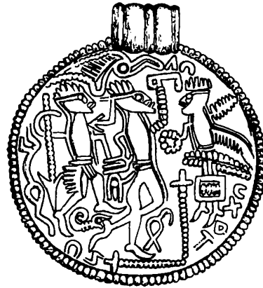
Fig. 3. "Drei-Götter-Brakteat" fra Skovsborg, Viborg amt (IK 165). 2:1. - B-bracteate from Skovsborg in northern Jutland (IK 165). 2:1

Bostorp på Öland (fig. 5; Axboe 1981 nr. 189a/3) hvis frisurer er udfyldt med et hestskoagtigt mønster, og måske også for en lille gruppe gotlandske brakteater med særligt udsmykket isse (IK 57,1-3, 233 og 258; Mackeprang 1952 pl. 8:12-14; Axboe 1981 nr. 207). Og fire stempelidentiske A-brakteater fra Gummersmark på Sjælland (IK 299; Mackeprang 1952 pl. 4:4) der viser en bevæbnet mandsbuste med en rytterfigur i skjoldet, er snarest inspireret af solidi udstedt 416 af Theodosius II (Almgren 1948 s. 81 f., trods indvendinger fra Malmer 1963 s. 96ff.). Går vi udenfor Norden, bygger A-brakteaten IK 374 fra Undley i Suffolk (Axboe 1981 nr. 307d) på romerske møntaverser der viser Urbs Roma som et hjelmklædt kvindehoved, kombineret med reversernes fremstilling af ulvinderen med Romulus og Remus. Denne mønttype opstod under Constantin den Store og fortsatte gennem hele 300-tallet; de bedste forbilleder er dog præget i Trier 330-35 (Hines & Odenstedt 1987 s. 74).