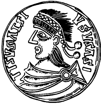
Fig. 6. Medaillon-efterligning fra Kälder, Linde sogn, Gotland (IK 286,1), avers. 2:1. - Medaillon imitation from Kälder, Linde parish, Gotland.