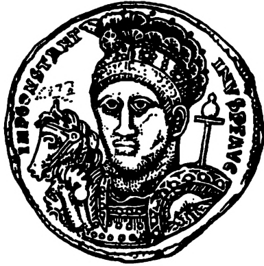
Fig. 4. Sølvmultiplum præget for Constantin den Store 315. 2:1. Efter IK 1,1. – Silver multiple of Constantine the Great, minted 315. 2:1.