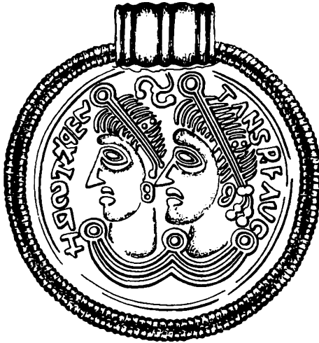
Fig. 2. A-brakteat fra Broholm, Fyn (IK 47,2). 2:1. - A-bracteate from Broholm, Funen (IK 47,2). 2:1.