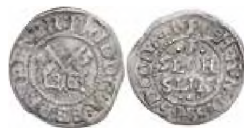
Figur 5. Ærkebispedømmet Bremen Frederik 3. Søsling 1641.