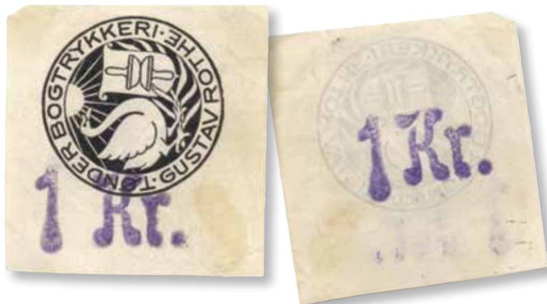
1 Krone. Længde: 5 cm. Højde: 5,2 cm

undgå, at man på den lokale genbrugsplads, skulle opdage containerens indhold, og der så kunne forsvinde noget, blev containeren sendt til Aabenraa. Men der forsvandt et papirlot, som kræmmeren fra Sønderjylland fik fat i, og nu er papirerne i Herning, som oprindeligt kom fra Gustav Rothes Bogtrykkei, i Tønder.