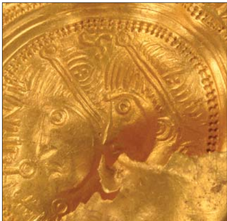
Fig. 7. Vindelev x20.

Også de to A-brakteater x16 og x19 forholder sig frit til forbillederne, men det vildeste eksempel er nok x7 (fig. 10 tv.). Hvad foregår der lige her? Vi ser det sædvanlige store mandshoved med diadem, som gerne skulle være Odin. Der er antydning af en hals, og under den en åben ring med kugleformede ender. Det er en torques , som romerne brugte som militær udmærkelse, i hvert fald i de første århundreder e.Kr. Herfra udgår der to arme; den bagerste holder et dyr med tungen ud af halsen, den forreste en T-formet genstand. På den står der en lille skikkelse med fiskeformet krop med en kugle i den ene hånd og en åben ring i den anden, og foran ham er der et træ eller en gren med seks kviste. Motivet er ganske usædvanligt; måske kan det sammenlignes med nogle få brakteater fra Nordsjælland og med en brakteat, der i 2018 blev fundet ved Kristianslund vest for Odense (fig. 10 th.). Den er næsten magen til Vindelev x7, men igen kun næsten: Der er færre kviste på grenen, mandshovedet er lidt