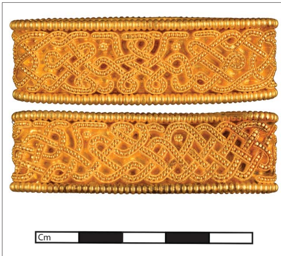
Fig. 11. Guldmundblikket x18.

dele, og der er meget, man kan undre sig over. Hvorfor er der for eksempel ingen sene brakteater i så stor en samling? Og hvorfor er Constans-medaljonen (x6), som kun er den næstældste mønt, slidt næsten til ukendelighed, mens de andre er meget bedre bevaret? Er fundet én mands eje, eller er det flere stormænd eller et helt herred, der har bidraget? Blev guldet gemt eller ofret som reaktion på den slørede sol i 536/37? Det er faktisk kun guldmundblikket, der kan tages som argument for det, og det