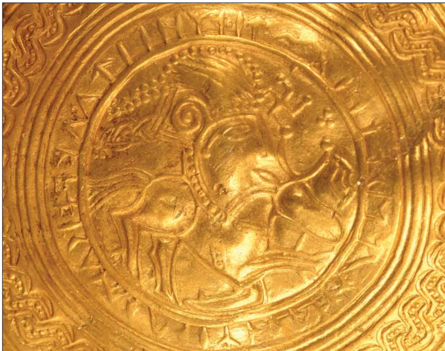
Fig. 4. Vindelev x11 (Se forsiden).