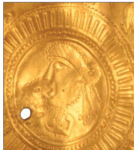
Fig. 6. Vindelev x9.

De to brakteater x10 og x20 (fig. 7) viser ikke kun én "kejserbuste", men to ved siden af hinanden. De er siamesiske tvillinger i den forstand, at deres kapper er tegnet i forlængelse af hinanden med i alt tre runde spænder. Det er en type, vi ellers kun kender fra Fyn: Tre stempelidentiske eksemplarer fra den store Broholm-skat ved Gudme (fig. 8), en enkeltfunden brakteat fra Elmelund