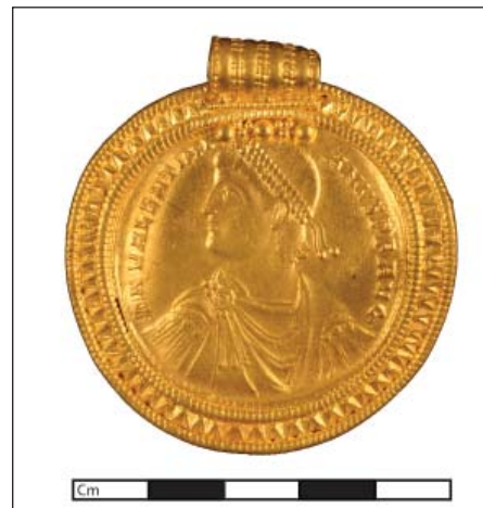
Fig. 1. To medaljoner. Tv. Vindelev x5, udstedt af Constantin den Store. Th. Vindelev x15, udstedt af Valentinian I.

genstande er godt bevaret, mens de store brakteater er bøjet og i nogle tilfælde krøllet helt sammen. Det skyldes antagelig, at hele fundet lå i pløjelaget, hvor plov og andre redskaber har været hårde ved de store brakteater, men vi skal naturligvis være opmærksomme på, om de allerede var ødelagt, da de havnede i jorden. Det kender man eksempler på fra andre fund, hvor genstande blev "dræbt", før de blev ofret.