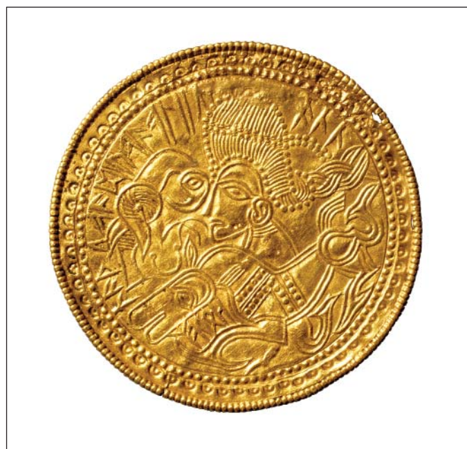
Fig. 2. Tv. Vindelev x4. Th. brakteat fundet på Fyn.