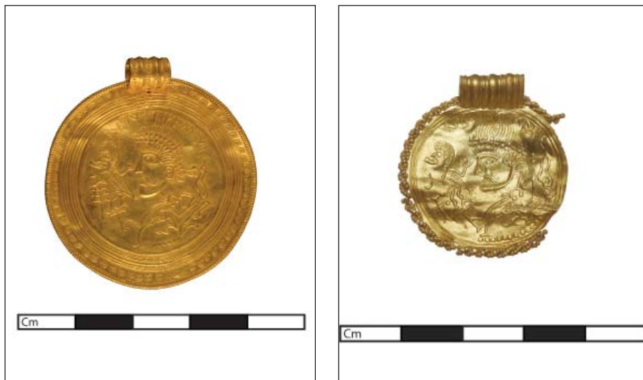
Fig. 10. Tv. Vindelev x7. Th. brakteat fra Kristianslund.

indsnævres, men hvis der ikke er tale om plyndringsgods, må man næsten tro, at de er erhvervet i de respektive kejseres regeringstid. Brakteaterne hører alle til den ældste halvdel af brakteatproduktionen; et slag på tasken vil være perioden ca. 450-490. Guldmundblikket er den tredje "klump"; det må være fremstillet nogle årtier inde i 500-tallet.