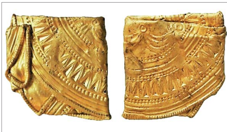
Fig. 9. Fladhamret brakteat fra Rågelund.

VejleMuseernes udgravning viste, at alle genstandene nu lå i pløjelaget, men