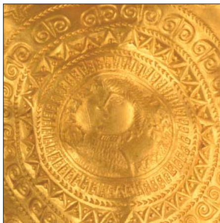
Fig. 5. Vindelev x14.

Den løftede hånd ses på enkelte andre A-brakteater, men her har mappa fået en nordisk omfortolkning, som vi finder det på de to brakteater x3 og x14 (fig. 5), der ser ud til at være præget med samme stempel. Her har "kejseren"