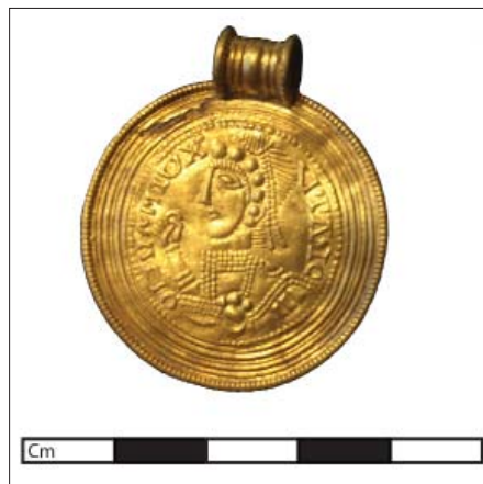
Fig. 3. Tv. Vindelev x1. Th. Constantius II i konsuldragt med det sammenfoldede tørklæde mappa i den løftede hånd.

Motivet er klassisk for de såkaldte C-brakteater: Et stort mandshoved over et (mere eller mindre) hestelignende dyr, og en fugl, der ser manden dybt i øjnene. På begge brakteater har manden et diadem, der går gennem håret, og en flot fletning i nakken, og dyret har tilsyneladende seletøj på og er af uransagelige grunde udstyret med horn. Men to detaljer kendes kun fra få andre brakteater: Man kan se mandens venstre arm med hånden, der hviler på dyrets hals, og mellem forbenene ser man hans ene fod. Og mellem dyrets hoved og dets forreste ben er der en runeindskrift, som er central for tolkningen af C-brakteaterne. Der står houaR , og det betyder "Den Høje". Det er et af de mange navne, Odin optræder under i de skriftlige kilder, og indskriften er et af mange indicier på, at det er ham, der som gudernes konge og magiens mester er hovedpersonen på brakteaterne. Diademmet var et af den romerske kejsers værdighedstegn (se fig. 3. th.), og det flettede hår kan være et "barbarisk" sidestykke. Vi ved i hvert fald, at den merovingiske kongeslægt i Frankeriget udmærkede sig fra resten af folket ved at have langt hår.