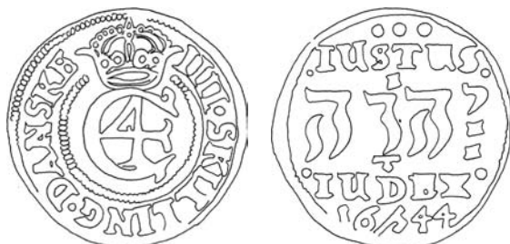
Fig. 5: Stempeltegning af hebræer 4-skilling.