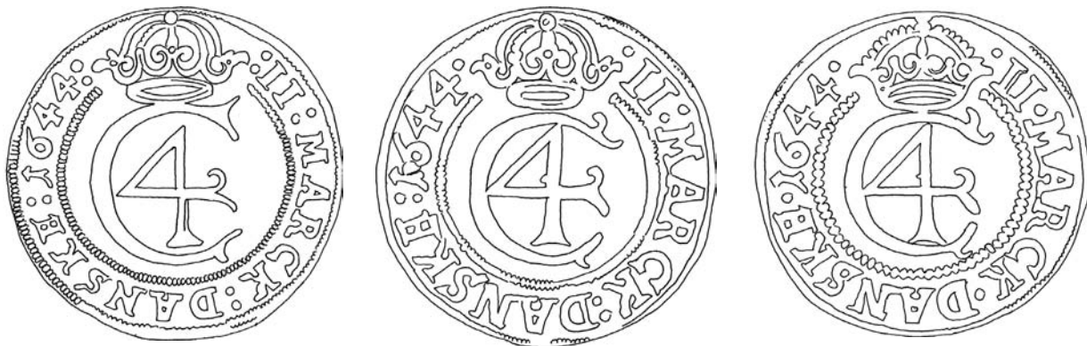
Fig. 3: Stempeltegninger af forskellige forsidestempler til hebræer 2-marker fra København 1644.