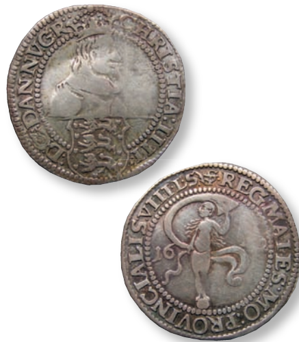
Fig. 1: Ved skattens eneste eksemplar af 8 skilling lybsk 1642 har Schou skrevet “bedre end min!”. Schou-nr. 16, H. 175A, ca. 270°, 4,40 g. Billede forstørret 120%.

Schou fik i 1920 mulighed for at undersøge Tømmerupskatten (fig. 1). Nogle af hans notater er bevaret i Møntsamlingens arkiv. De belyser, hvorledes han på det tidspunkt i praksis arbejdede med sit møntka-