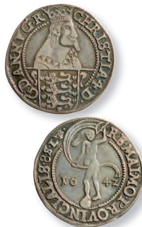
Den foreløbigt unikke, type T2. Bemærk det lidt "primitive" portræt.

Omskrifterne skal ikke gengives her, da de fremgår af stempeltegningerne. Hvad angår forsidestemplerne anvendes samme tekst på alle stempler med den undtagelse, at kongens nummer – som tidligere nævnt – i 1642 ændres fra IIII til 4. For bagsidestemplernes vedkommende forkortes teksten i 1642, ligesom værdiangivelsen VIII ændres til 8 og forkortelsen LS (= lybsk skilling) vendes om til SL (= skilling lybsk) 19 .