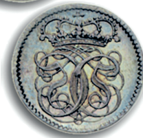
1 eller 2 dukat (1675) med tilhørende solvafslag (H.7-8, Sieg 86-87).