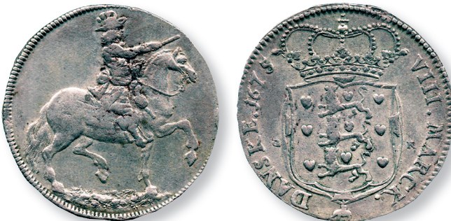
2-krone 1675, H 72, med "græsbund".