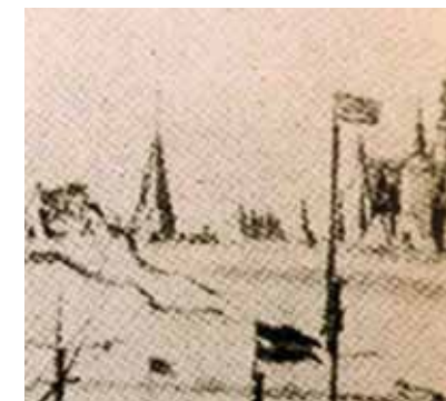
Fig. 2a. Skitse til et by-prospek af Willem van de Velde.