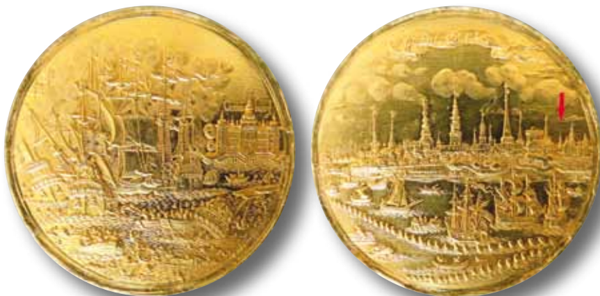
Fig. 8. Medalje over slaget i Øresund 1658. (Nørreport markeret med en rød pil)

Nicolaj Kirke, Helligånds Kirke, Frue Kirke, Sct. Petri Kirke, Rundetårn, den noget høje tagrytter på Trinitatis Kirke og endelig Rosenborg med flere tårne. Disse tårne er let genkendelige på afbildninger af medaljen, men et lille spir mellem Trinitatis Kirke og Rosenborg kan ikke rigtig identificeres på almindelige katalogafbildninger af medaljen og er i det hele taget ikke tilstrækkelig velpræget på eksemplarer i sølv. På det viste meget velprægede guld-eksemplar kommer dette lille spir imidlertid til sin ret (se Fig. 10). Der er ikke tvivl om, at det lille spir er sammensat af mange spidser, og da det er placeret lige der, hvor Nørreport ligger, kan det næppe betvivles, at der er tale om spiret vist i Figur 2. Vi har altså i denne medalje en samtidig (se argumentationen nedenfor) afbildning af det meget dårligt dokumenterede spir.