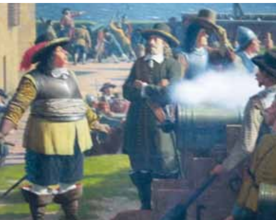
Fig. 7. Carl Gustav på Kronborg (maleri af Heinrich Hansen på Frederiksborg Slot).