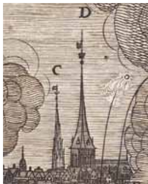
Fig. 12c. Detalje med Nicolaj.