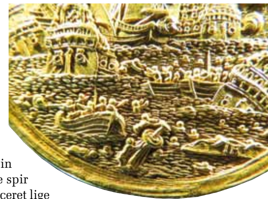
Fig. 9. Detalje af søslag

Det kan så lige anføres, at Jeremias Hercules faktisk fik sine penge og tjente kongen videre frem til sin død i 1689.