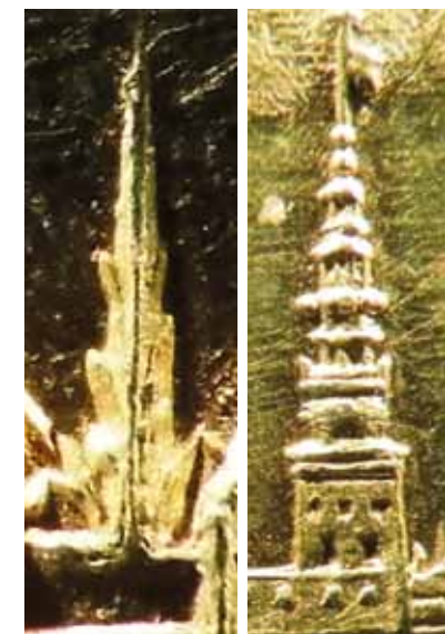
Fig. 10. Detalje med Nørreport.