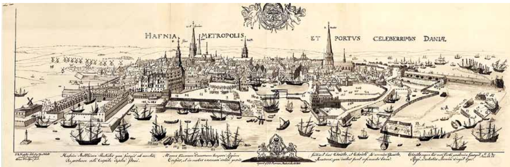
Fig. 1. Johan v. Wick's prospekt over København fra 1611

Et udsnit af en kopi med gengivelsen af Nørreport er vist i Figur 2a. På baggrund af det originale udkast, som antagelig viser bedre detaljer af spiret, er der i 1880 lavet en rekonstruktionstegning (Fig. 2) som viser et spir med mange små sidespir i lighed med, hvad man kan se i Prag. Dette spir findes gengivet i et by-prospekt på en medalje samt et kobberstykke by-prospekt, som ikke er medtaget i værket 'København før og nu – og aldrig'. Disse prospekter er emnet for nærværende lille skrift.