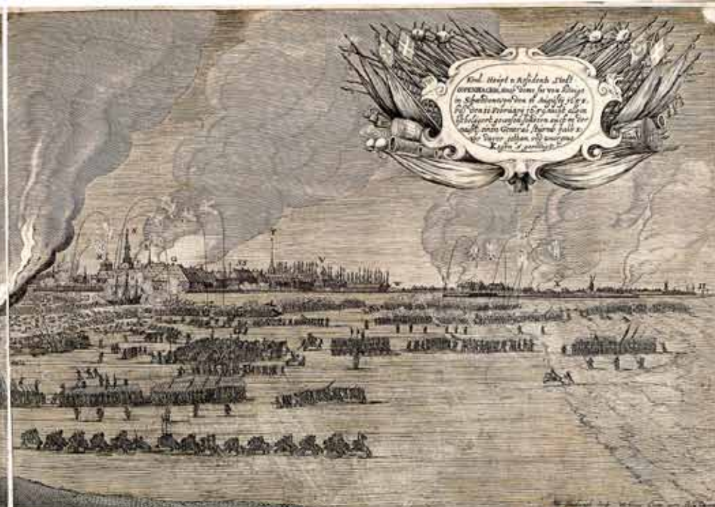
Storn Leibe litten angbraucht. S. MARIA Die Haupt kirche. O. kongl. Luftbauße Rosenkurch. H. herlige gessl. kirche. I. Der wallhauf de beise. T. kongl. vnd stadsche arkienße stette. V. Christen hoffneer Brügge. W. christen hawen. X. storte assj. Anack. H.