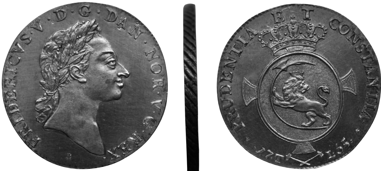
Frederik V, speciedaler 1765, prakt eksempalar fra Hovedsamlingen.

i pløjelagene. Det er generelt imponerende dygtige, flittige og samvittighedsfulde folk, som gerne må gå på lokalmuseum eller Nationalmuseum og prale overfor barn og barnebarn af deres fund, som kan ses i udstillinger. En del nordmænd og svenskere kommer til Danmark for at gå med detektor – jeg har sendt flere danefæbreve til Norge. Men husk: Danmark er annerledes enn Norge og Sverige. Vi kjenner ikke "almennretten" – retten til å ta seg frem på annen manns jord. Skal du lete må du ha grunneiers tillatelse, enten grunneieren er privat, kommunal eller statlig. Danefægødtgørelsen gives til finderens – sådan er loven. Det er en findeløn, ikke et kjøb eller en indløsning. Genstandene var allerede statens før de blev fundet.