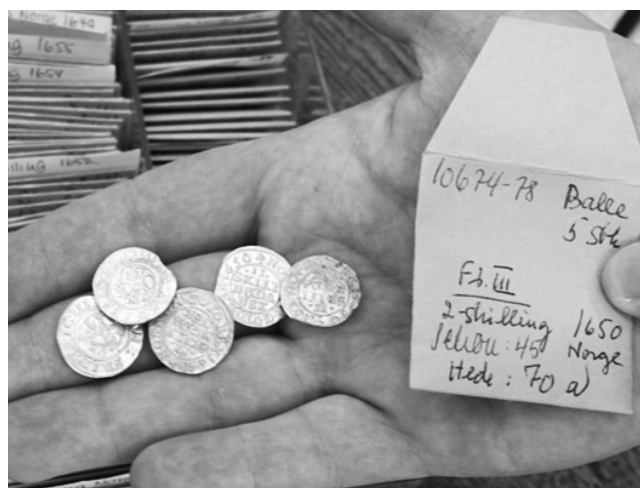
Fundsamlingens norske mynter i konvolutter.

Vi har en glimrende lov, der har virket siden 1700-tallet. Alle jordfunn av en viss alder tilhører staten