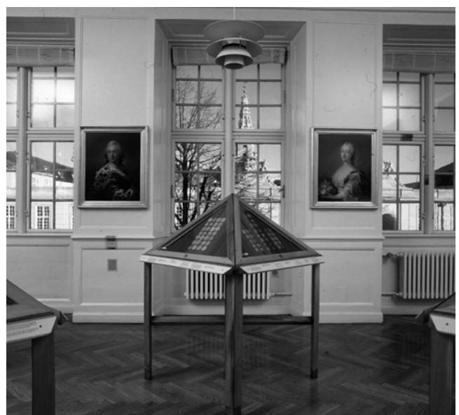
"Møntsamlingen" presenteres i elegante omgivelser, her rommet for "Verdens Mønt".

Museet har et sted mellom 600- til 700.000 objekter: mynter, medaljer, poletter, sedler og diverse annet f.eks. prægestempler – og i dette: "verdens største samling av "norske" dansketidsmynter". Møntsamlingen består av to deler. Hovedsamlingen, som er den typologiske samling, hvor prakt eksempeler av norske mynter ligger enkeltvis etter Schou-numre. Den annen del er