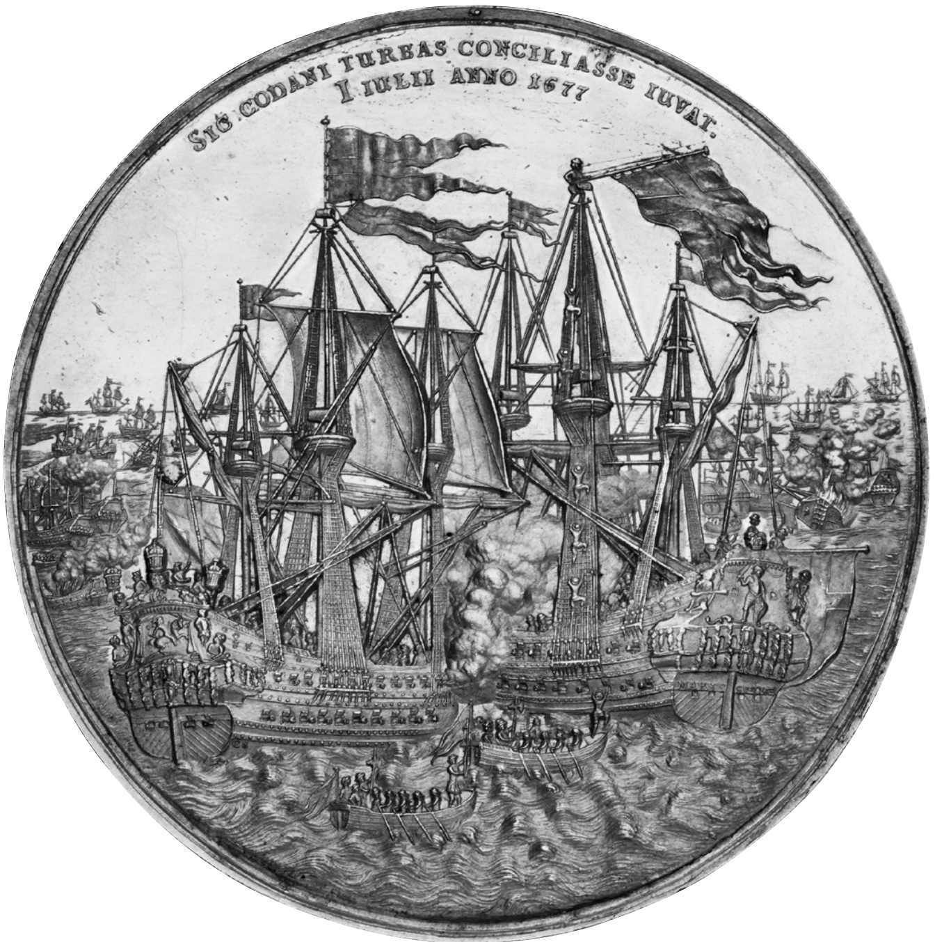
Schneiders medalje til minne om slage i Køge bukt (se omtale i NNT nr. 2-2013). Dette eksemplaret er i massivt gull (vekt 661 gr.). Et av Michaels mange pågående projekter er forskning omkring denne medalje. (foto: Nationalmuseet).

nordeuropeiske fastland – kanskje kan ønsket om å studere et ellers utilgjengelig verk være formål godt nok for et besøk i studiekammeret?