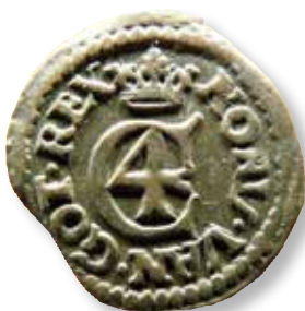
Figur 10: To eksempler på Hvid 1619. Monogrammerne er meget forskellige fra 2 Marken 1646.