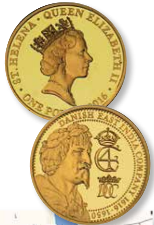
Figur 2: One Pound 2016 fra Sankt Helena.