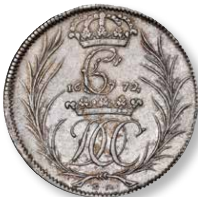
Figur 9: DOC-Specie fra 1672.