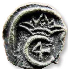
Figur 11: Tranquebar-mønt med Christian IV's monogram.