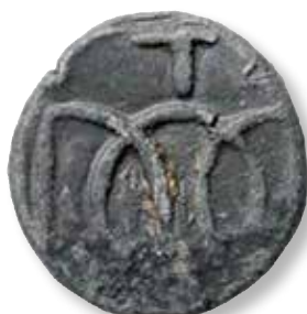
Figur 12: Tranquebar-mønt fra Christian IV's tid med DOC-logo.