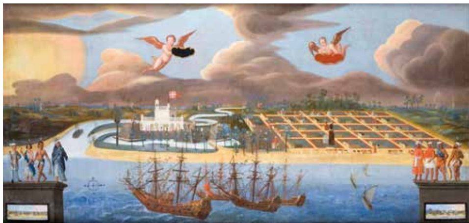
Figur 6: Fortet Dansborg til venstre og selve byen Tranquebar til højre herfor. Maleri fra ca. 1650. Skokloster Slott, Sverige.

skabt med forbillede i bronzestatuen på Rosenborg Slot (Figur 7). Christian IV's monogram har også et éntydigt forbillede, og her har man endda gjort sig umage med et møntstudium.