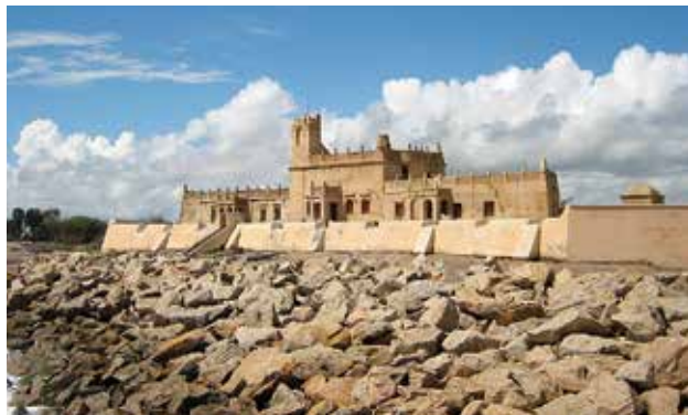
Figur 5: Dansborg i Tranquebar som det tager sig ud i nutiden.