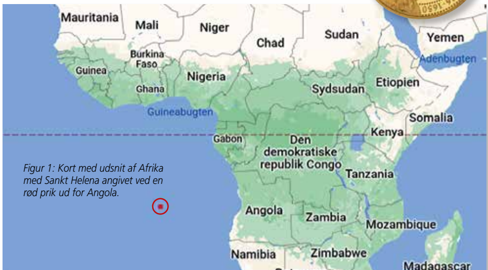
Figur 1: Kort med udsnit af Afrika med Sankt Helena angivet ved en rød prik ud for Angola.