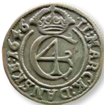
Figur 8: 2 Mark 1646 fra København.