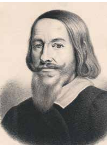
Figur 4: Ove Gjedde. Kobberstik efter maleri af Abraham Wuchters (1608-82) – dansk/nederlandsk maler.

Gjedde, hvilket sætter sig spor i den adelsambitiøse Jens Munk, som er meget bitter over denne udskiftning. Jens Munk sendes i stedet på en ekspedition for at finde 'Nordvestpassagen' til Indien, og Jens Munk opfatter sin ekspedition som et kapløb med Ove Gjedde om at nå Indien først. Dette kapløb er nok ikke det bedste udgangspunkt for hans katastrofale rejse til Hudsonbugten 1 .