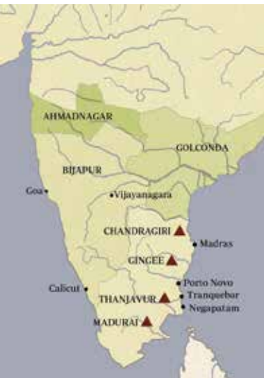
Figur 3: Kort over Indien, hvor Tranquebar ses på Østkysten lidt nord for Ceylon.