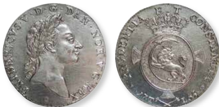
Fig. 1. Norsk 1 speciedaler 1765. Nationalmuseet, KMMS GP 678.