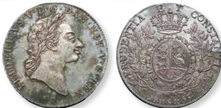
Fig. 2. Dansk 1 speciedaler 1765. Nationalmuseet, KMMS, Beskrivelsen af 1791, nr. 163: Foto: Frank Pedersen.

cies Stempler, som Jeg efter Höye Ordre d: 15de Martij h.A. Leverede i Det Kongel: Cammer=Collegio, og som blev opsendt til Kongsberg nu atter her paa Mynten i Behold. 14