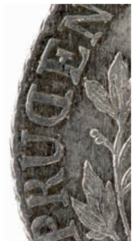
Fig. 9. Udsnit af Bauerts stempel med tekstfejl.

Møntmester Knoph rapporterede d. 21. marts 1765, at der ved prægningen af de 69.250 mønter i 1764 var forbrugt og destrueret 11 stempler, alle skåret af Bauert. Der var desuden henlagt 7 stempler (3 af Bauert, 2 af Adzer og 2 af Wolff), 20 men det fortælles ikke, om de havde været