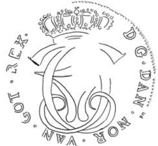
f 68-3 Type 1A