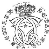
f 69-11 Type 6