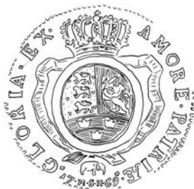
b 69-9 type 5