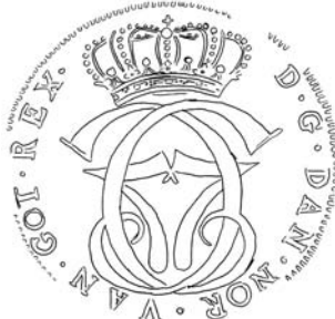
f 68-2 Type 1A