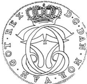
f 69-8 Type 2C og 2D