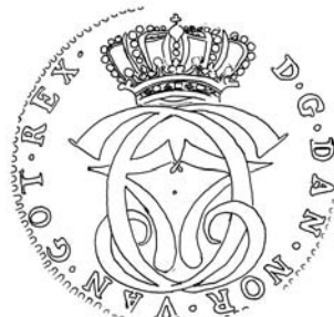
f 69-2 Type 1B og 2C