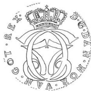
f 69-6 Type 2B