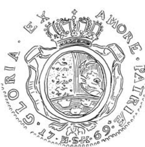
b 69-4 Type 2A