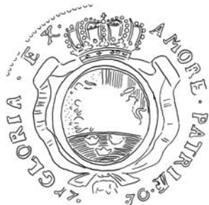
b 70-1 Kun anvendt til prøvemønt Type 2D