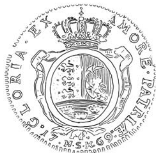
b 69-5 Type 2B og 3