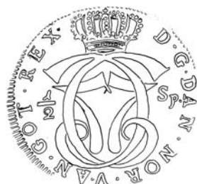
f 69-10 Type 5