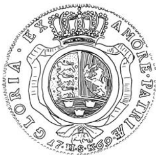
b 69-6 Type 2C