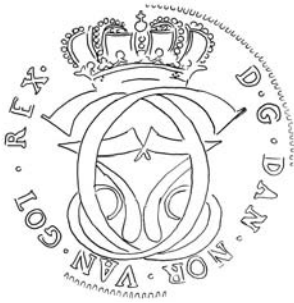
f 68-1 Type 1A

Stempelbeskrivelse, se afsnittene om forside- og mønttyper, side 10 og 11-16.