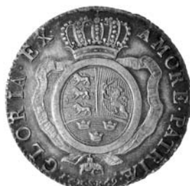
1/2 specie med værdibetegnelse, Hede 9A