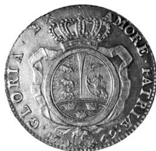
Specie med nyt bagsidemotiv, Hede 8