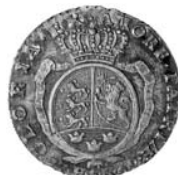
1/4 specie 1769, april 1769, Hede 10

af specier". Som eftertiden har kunnet konstatere, fik Knoph sit ønske opfyldt (Hede 9B og 10), men da de anvendte "specie-plader" var alt for tykke til de mindre nominaler, måtte mønterne for at kunne holde den forekrevne vægt gøres mindre end ønskeligt var.