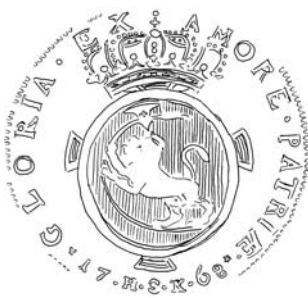
b 68-2 Type 1A