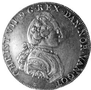
Portrætspecien, august 1769, Hede 7

havde givet Knoph ferie". Nogle måneder senere forlod Knoph så Rethwisch og rejste hjem til København, og resten af året skulle vise sig at blive præget af stor usikkerhed om Møntens videre skæbne.