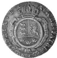
1/2 specie 1769, april 1769, Hede 9B