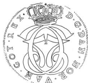
f 69-7 Type 2C