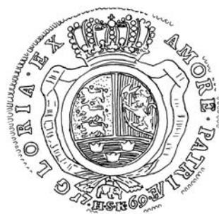
b 69-7 Type 2C