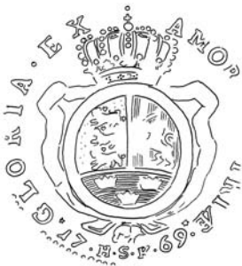
b 69-3 Type 2A