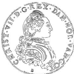
f 69-5 Type 3