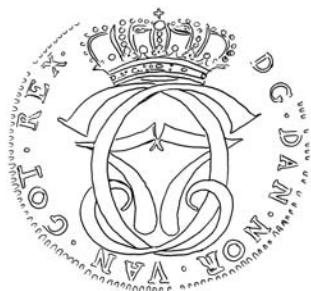
f 69-4 Type 2A