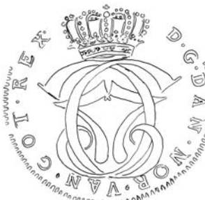
f 69-1 Type 1B