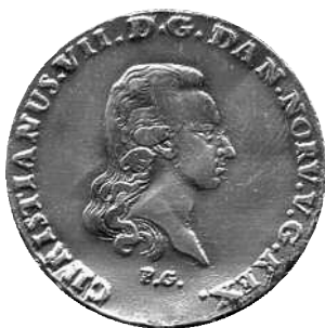
Specie 1800, Hede 39E, forside Gianelli

Det endelige resultat af Gianellis vikariat blev, at han skar stempler, der anvendtes ved udmøntningen af i alt fire møntværdier i 1799 og 1800: 1 speciedaler, \frac{1}{12} speciedaler, \frac{1}{24} speciedaler og 2 sechsling, hvoraf de tre sidstnævnte ikke tidligere har været publiceret som Gianelli-prægninger.