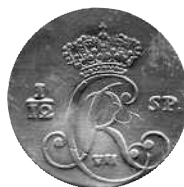
1/12 speciedaler 1800, Hede 43. Forside Gianelli, bagside Bauert