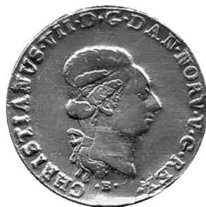
Specie 1799, Hede 39A, forside Bauert