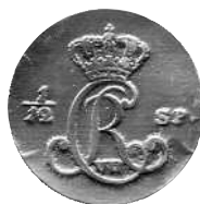
1/12 speciedaler 1800, Hede 43. Forside Bauert, bagside Gianelli

Samtlige stempler til mønterne med årstal 1801, Hede 39A og 13A, er skåret af Bauert.