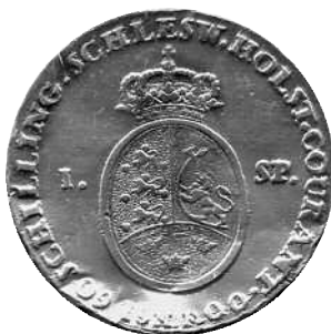
Specie 1800, Hede 39E, bagside Gianelli