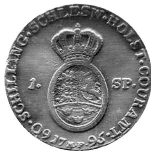
Specie 1799, Hede 39A, bagside Bauert