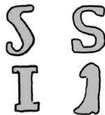
Gianellis og Bauerts S og 1-tal

Bagsiderne skiller sig også klart ud med relativt små, lidt kantede og sammentrykte kroner med strittende blade i hver side af kronebåndet til forskel for Bauerts større og mere fyldige kroner, som bl.a. ses på specierne Hede 39A.