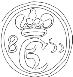
Hede I/344 (ex. Glückstadt) (bly); KSH 376/437 = HØI 9/613 = HØI 21/984 (bly, afrundet og stærkt korroderet blanket).