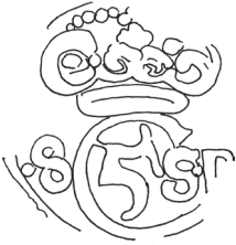
LEB (stanniol) Metal usikkert