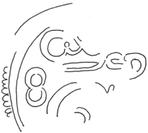
Eremitagen (stanniol) kobber