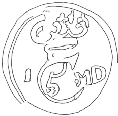
KMK (stanniol) bly