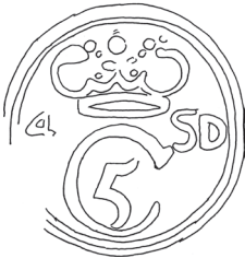
HØI 10/1775 (bly); HØI 18/750 (bly) + privat- samling