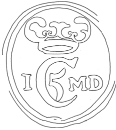
ex. PHK 8/164 = KMMS. kobber