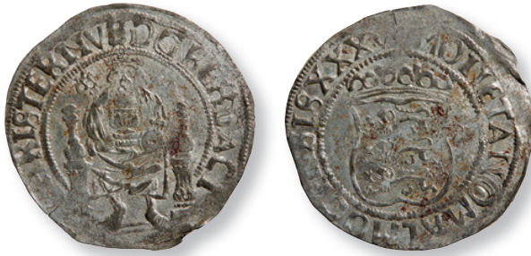
Figur 4. Fyrskilling präglad 1535 i Malmö, daterad XXXV. Den kongelige Mønt- og Medaillesamling, FP 9827.658.

Ca. 125%.