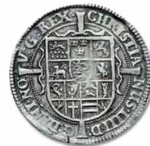
Figur 13. Piaster fra 1624. Hovedvåbnet centralt - Oldenburg og Delmenhorst fornedet.