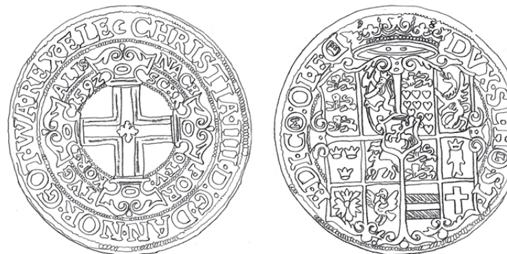
1. Dobbelt Portugalløser. (Hede 4) 1592 S.1