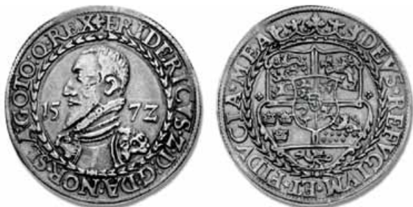
Figur 2. Speciedaler fra Frederik II. Bemærk våbenskjoldet med Oldenburg og Delmenhorst i centralskjoldet.