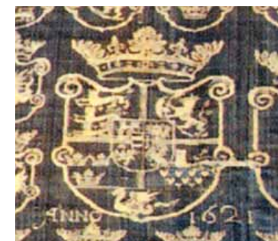
Figur 6. Detalje af dug fra silkevæveriet dateret 1621, nu i Moskva.