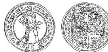
9. Ungersk Gylden. (Hede 8B) 1593 S.3-4

8.2 Møntens diameter 36 mm. (Hede 7B) 1592 S.8 1593 S.2