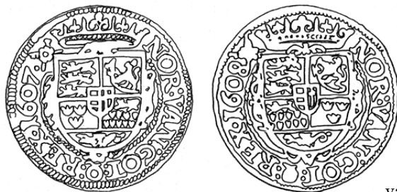
Figur 14. Ungersk gylden 1607-8. Bemærk at Gother og Tre Kroner har byttet plads.