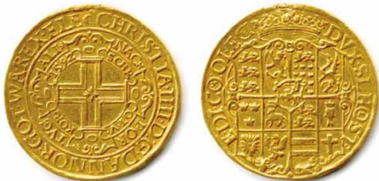
Figur 1. Dobbelt portugalsøer fra Haderslev.