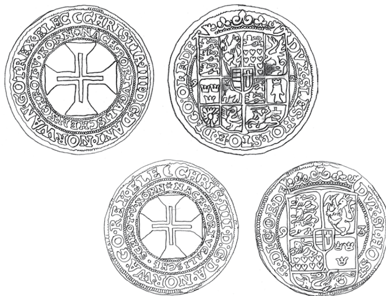
7. Halv Portugaløser.

7.1 Møntens diameter 41 mm. (Hede 6) 1592 S.6 1593 S.1