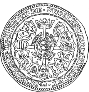
Figur 4. Eksempler på rigsvåbnet organiseret med hovedvåbnet i centrum og de øvrige i en krans. A: Stik fra ca. 1608. B: Kirkeportalen fra Frederiksborg (foto TJH). C: Dekoration over porten i det store indgangstårn på Frederiksborg (foto TJH). D: Speciedaler 1609.

antyder selv det usandsynlige i dette, idet han nævner, at det var normalt for alle fyrster at slå underlødige mønt, og endelig kendes lødigheden af Haderslevmønterne ikke.