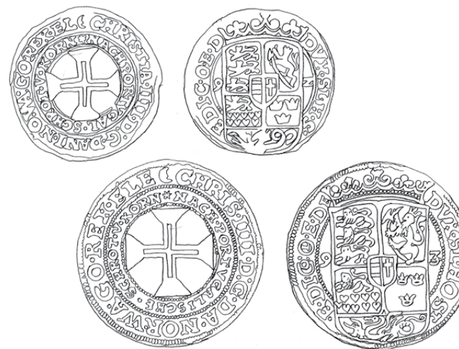
8. Kwart Portugaløser.

7.2 Møntens diameter 36 mm. (Hede -) 1592 S. (Jeg har kun oplysninger om denne mønt via Siegs møntkatalog. Jeg antager, at møntens præg er som nedenstående type 8.2.)