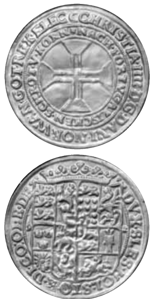
Figur 3. Staniolaftryk af portugalløser fra Haderslev. I nederste højre felt ses Ditmarsken, men der ses tydelige rester af korset fra Delmenhorst.

ker og en højre halvdel med delmenhorsts kors (højre/venstre er set fra beskueren).