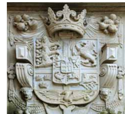
Figur 7. Portal fra badstuehuset ved Frederiksborg (1580).