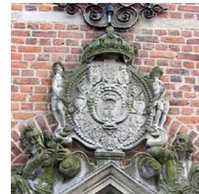
Figur 5. Portal fra Trefoldighedskirken i Kristiansstad, Skåne.

Den fremstilling af rigsvåbnet, som er benyttet på de tidlige Haderslevmønter, findes ikke på senere mønter, men udenfor møntverdenen er denne fremstilling fundet i en del tilfælde fra Christian 4's senere år (se figur 8-11). Endelig bør det nævnes, at der på mønter optræder en fremstilling, som minder om den af rigsrådet ønskede